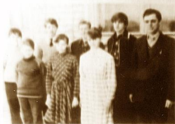
1. СОЛИКАМСК • 40 очков