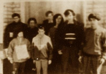
2. ФЕРМЬ • 31 очко