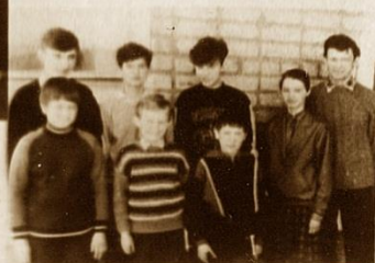
3. НИСЫВА • 30,5 очка