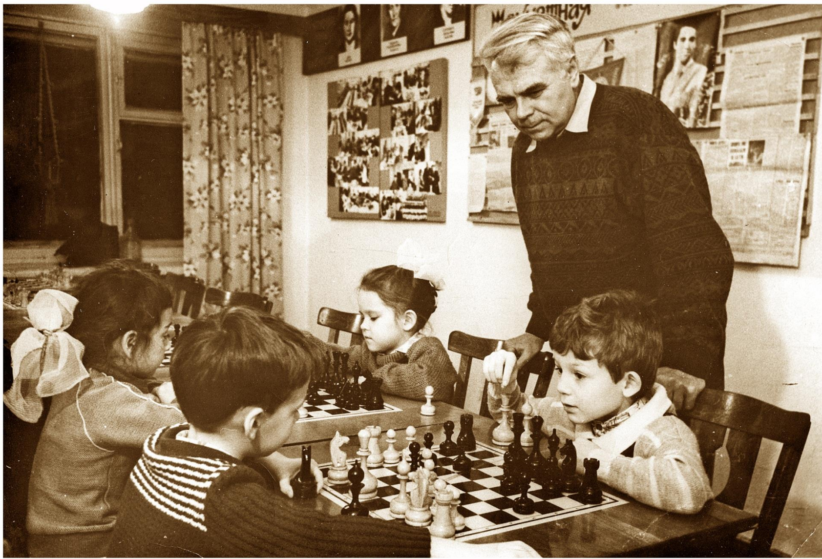
Подростковый клуб «Факел»