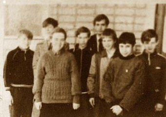
4. РУЖИЦЫ • 26 очков