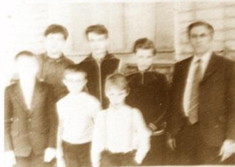
5. БЕРЕЗНИКИ • 23 очка