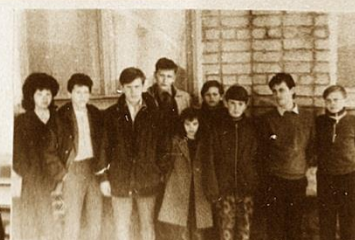
8. ЧАЙКОВСКИЙ • 7,5 очка