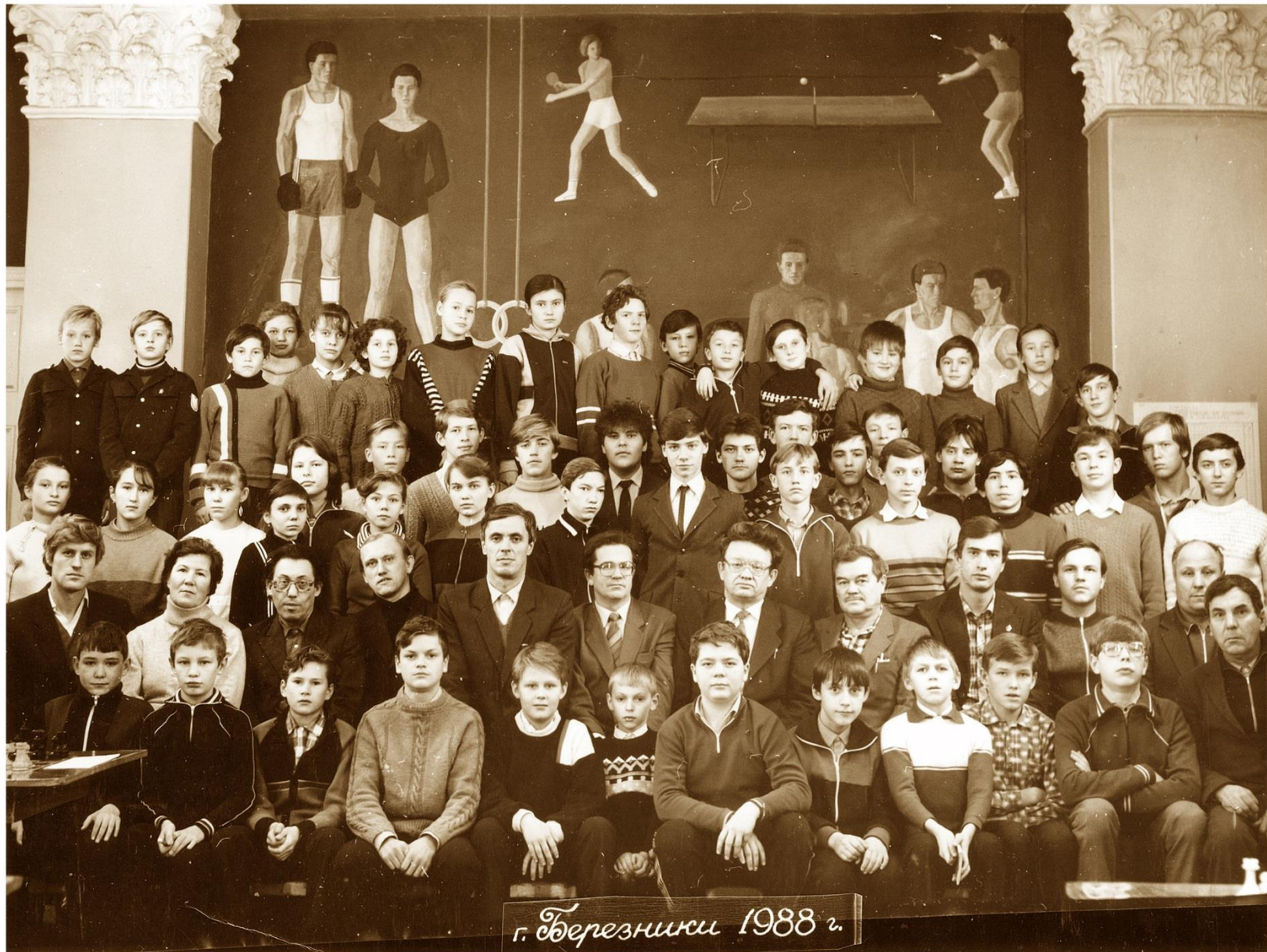
г. Березники 1988 г.