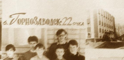
6. ГОРНОЗАВОДСК • 22 очка