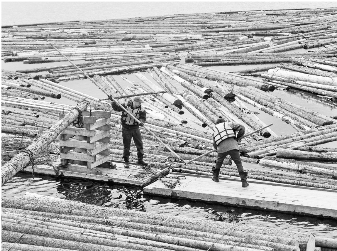
Все плоты без происшествий доставлены в затон. Для работников ЛСП начинается горячая пора

— Сколько составил максимальный уровень воды?