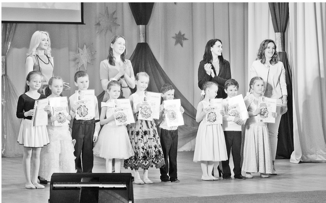
Самые яркие «звёздочки» детских садов «Золушка», «Теремок» и «Сказка»

А начинается всё с величественного и нежного вальса — ведут в танце своих маленьких партнёров юные гусары из детского сада № 45. А вот на сцену за любимой воспитательницей из-за кулис робко выходят самые маленькие — воспитанники групп раннего возраста детского сада № 22. Крошечные ножки, обутые в праздничные сандалики, выводят танцевальные пары. Маленькие ручки крепко прижимают к груди любимую игрушку. Ну как тут не растрогаться и не поддержать крох громкими аплодисментами?!