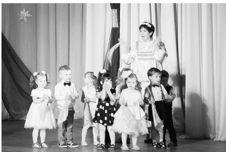
«Пляска с платочками» детишек из групп раннего возраста (д/с № 45)