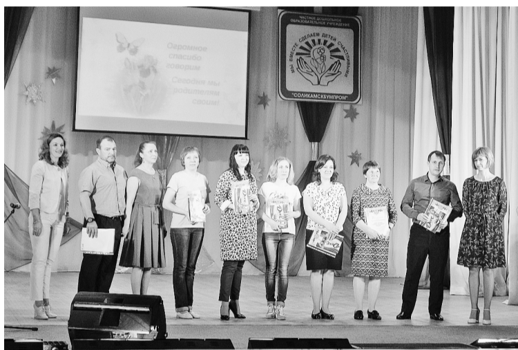
Активные, неравнодушные, творческие папы и мамы

Казалось бы, всего несколько минут длится каждый номер. Но какая грандиозная подготовка стоит за каждым выступлением! Бесчисленные репетиции, подбор костюмов — всё как у настоящих артистов.