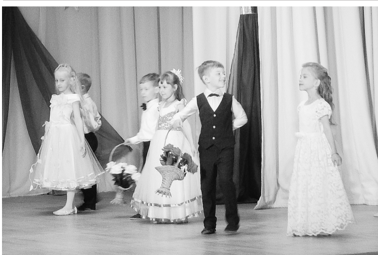
Прекрасны, как весенние цветы — юные цветочницы и их спутники (д/с № 22)