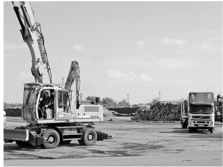
Наведение порядка на складе древесины

— Да. Перед службой лесозаготовок и лесоснабжения поставлена задача увеличить объём поставки древесины на предприятие сплавом до 650 тысяч кубометров. 500 тысяч