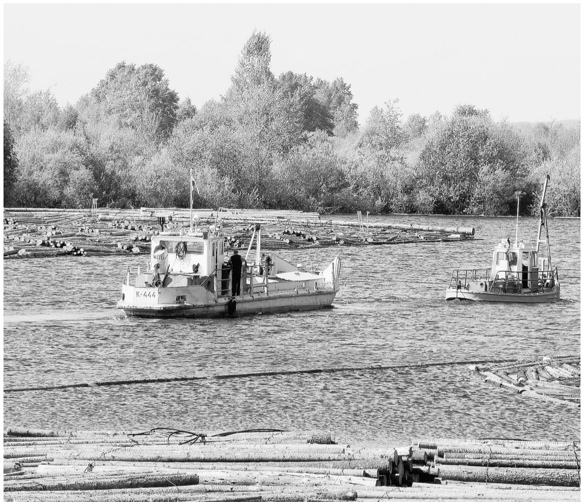
Плоты в затоне. В дело вступил участок водного транспорта

Продолжим использовать оба новых плотбища и в следующую навигацию.