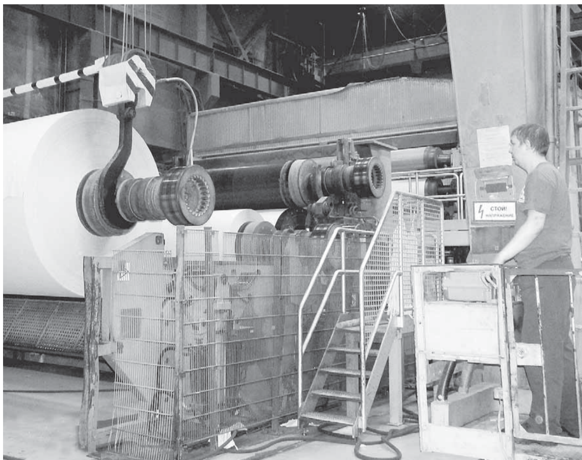
Сушильщик 6 разряда Павел Константинович Паршаков перевозит тамбур с БДМ № 2 на ПРС.

ПОСЛЕ РЕМОНТА ОБОРУДОВАНИЯ И ЗАМЕНЫ ОТДЕЛЬНЫХ УЗЛОВ И ДЕТАЛЕЙ ВО ВРЕМЯ ПЛАНОВОГО ОБЩЕГО ОСТАНОВА ТЕХНОЛОГИЧЕСКИЙ ПЕРСОНАЛ БУМАЖНЫХ ПРОИЗВОДСТВ ОЖИДАЕТ ПОЛОЖИТЕЛЬНЫХ ИЗМЕНЕНИЙ В РАБОТЕ МАШИН.