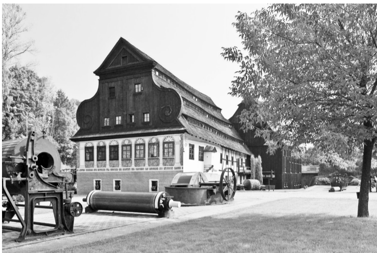
Музей в Польше

На сайте музея бумаги «Бузеон», что в в Калужской области http://www.buzeon.ru изучайте интерактивную карту