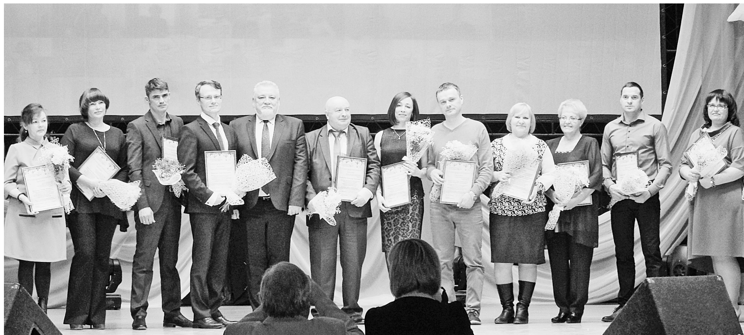
Награждённые Благодарственным письмом главы города Соликамска

По традиции в канун Первомая Соликамск пригласил на праздник представителей трудовых коллективов. Название торжественного мероприятия остаётся неизменным и отражает его суть — «Славим труд в цветении весны!».