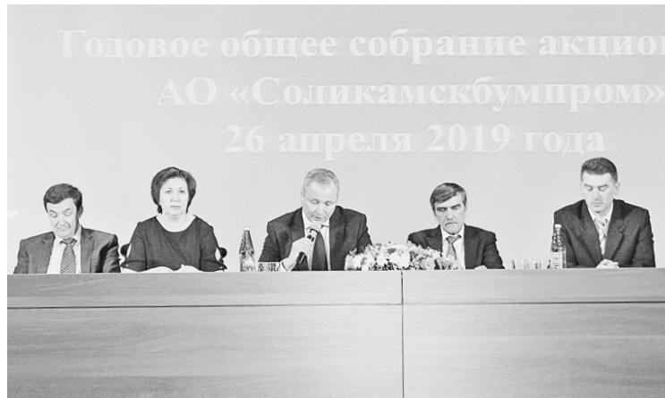
Члены Совета директоров АО «Соликамскбумпром»

На основании принятого Коллективного договора работникам Общества в 2018 году