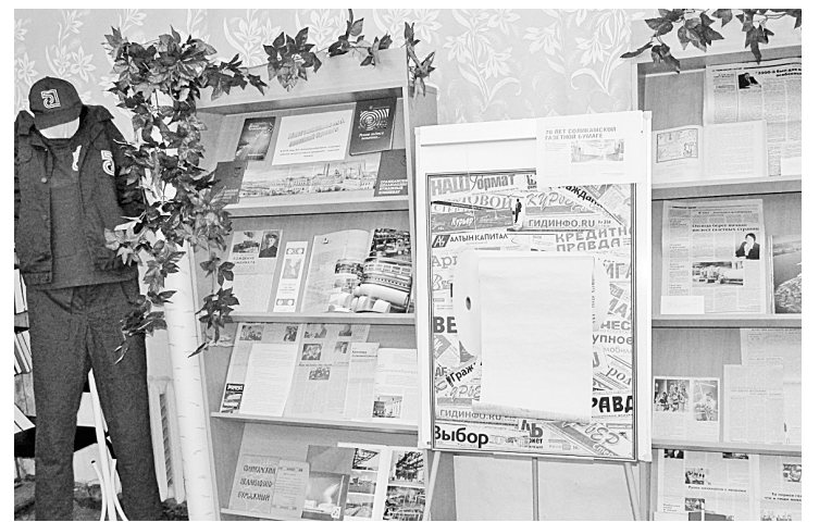
Соликамской бумаге 70 лет

На соликамской бумаге печатается более 20% российских газет. Предприятие осуществляет поставки продукции в страны ближнего и дальнего зарубежья. В 2019 году юбилей основной продукции АО «Соликамскбумпром» — газетной бумаги. Этому знаменательному событию посвящена нетрадиционная выставка, оформленная в библиотеке №2.