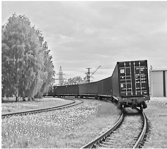
В контейнерных поездах соликамская бумага отправляется к покупателям

— Сегодня да, но в 2020 году, когда АО «Соликамскбумпром» на своих производственных мощностях наладило производство интерлайнера — бумаги для средних слоев гофрированного картона, рынок газетной бумаги был в упадке. Теперь АО «Соликамскбумпром» кроме рынка газетной вышел на рынок упаковки, который в условиях пандемии и развития онлайн торговли стремительно взлетел на новый