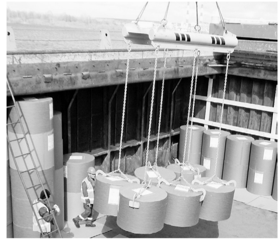
Отгрузка продукции на судно. Навигация - 2022

— ООО «СОПАПЭКС» является фактически представителем комбината в Москве, и речь — не о поддержке, а о взаимодействии. Это постоянная совместная ритмичная работа.