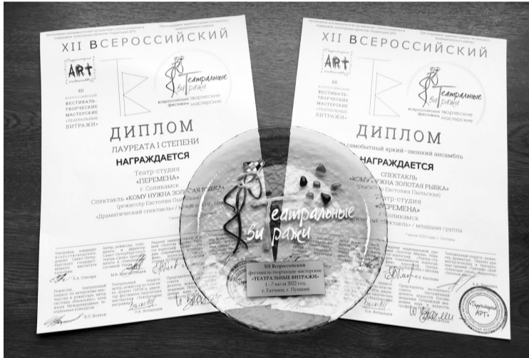
Копилка «Перемены» пополнилась наградами

«Все 40 минут на одном дыхании на сцене работала команда — единое целое». «Мы поверили в то, что происходило на сцене». «Великолепные костюмы, танцы,