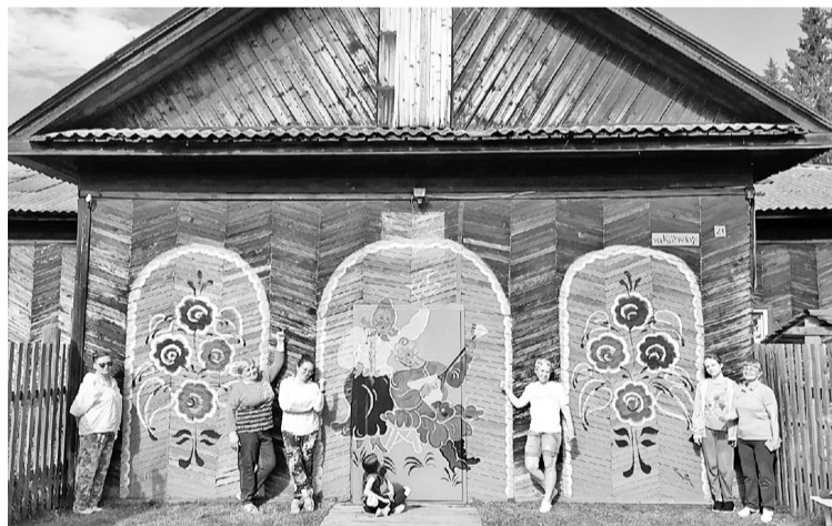
Дом культуры, он же — клуб, принарядился к юбилею и фестивалю

Я уже имела небольшой опыт росписи деревянных конструкций, и ожидала, что будет интересно. Но, испытала настоящий восторг от всего происходящего. Уже на подходе к объекту преобразования, мы почувствовали, как умиротворяюще действует деревенский уклад, насколько чист и прозрачен воздух. К работе приступили с вдохновением. Вот только уральская непредсказуемая погода решила поубавить наш творческий пыл — сначала закапал, а потом полил дождь.