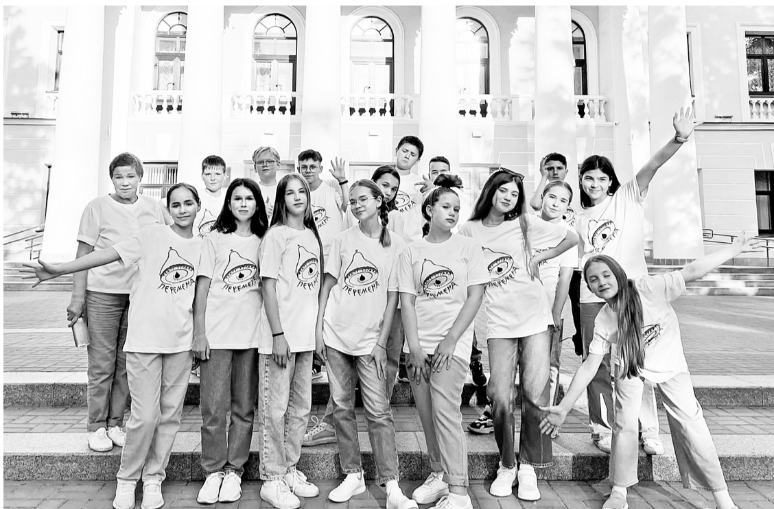
Вот они — такие яркие и звонкие переменовцы. Гатчина, 2022