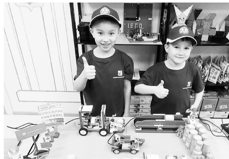
«БУМИКИ» представляют свой проект

18 января в Соликамске прошёл третий межмуниципальный этап Всероссийского робототехнического форума дошкольных образовательных организаций «Икарёнок 2020» для детей дошкольного возраста.