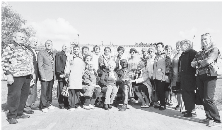
Представители первичных ветеранских организаций города в гостях у АО «Соликамскбумпром»

В городском Совете ветеранов войны, труда, Вооружённых сил и правоохранительных органов, в который входят представители первичных ветеранских организаций города в количестве 31 человека, с недавних пор сложилась традиция — проводить выездные заседания на территориях предприятий — членов Совета.