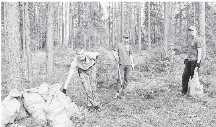
МО «Бумеранг» провёл генеральную уборку любимого места отдыха соликамцев

Мир не изменится сам по себе. Во всяком случае, так быстро, как нам хотелось бы. Молодёжное объединение «Бумеранг» предпочитает не ждать, а действовать.