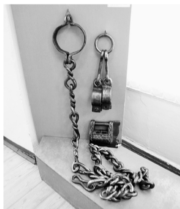
Оковы Михаила Романова

бесчисленные пожары, в которых Чердынь, бывало, сгорала полностью. И в настоящее время от древних построек остались только церкви. Бог даёт. Бог забирает. Этот завет помнили чердынские купцы и выделяли собственные средства на постройки общественных зданий и церквей. В одной из часовен стоит памятный камень, на котором написано: «Гражданам всех сословий и званий, чьим трудом и попечением стоит город Чердынь. Благодарные потомки. 1451—2011 г.»