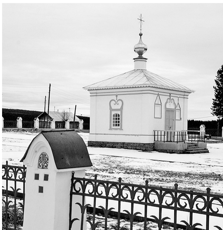
Часовня над ямой