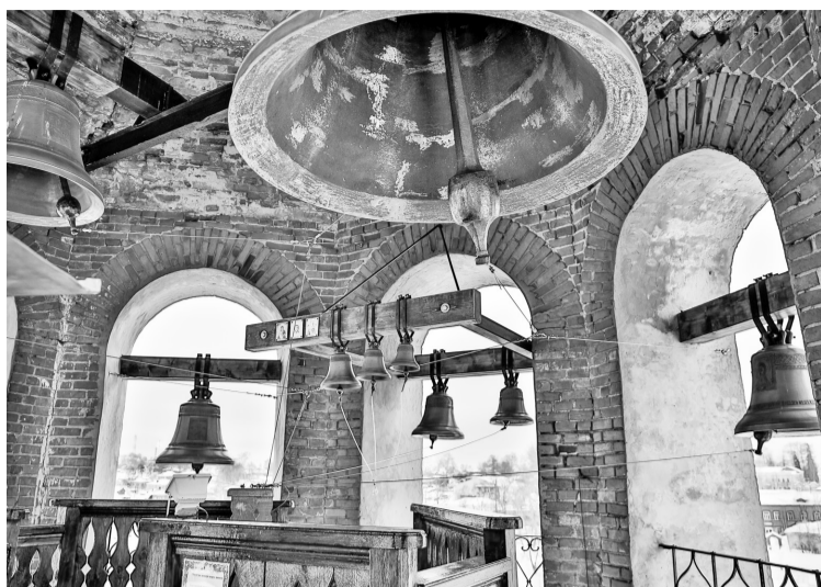
На колокольне храма

В краеведческом музее нам показали необычные находки XV—XIX веков. Мне запомнился рассказ об именитых людях-купцах, которые в своё время много сделали для развития Чердыни. Но всё же главными архитекторами города были