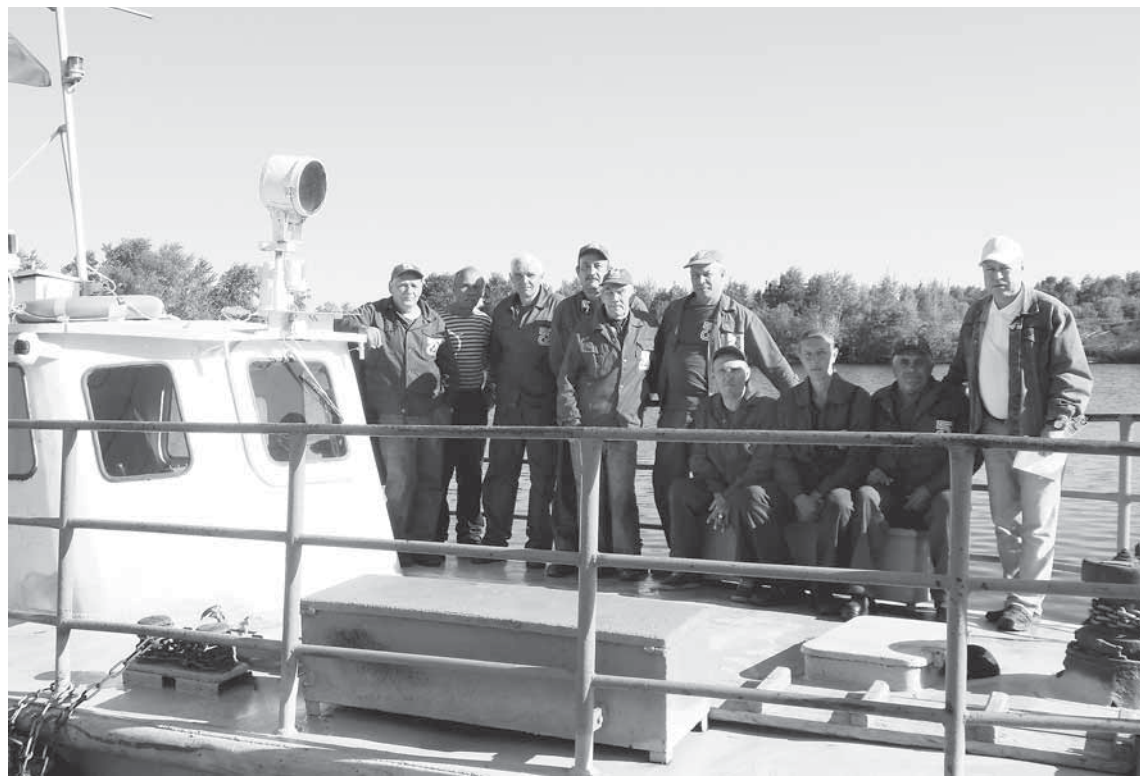
Дружная команда участка водного транспорта.

Регата соберёт на водной площадке десяток команд, которые борются за звание лучшей. Также все дни водно-спортивного праздника будут работать музеи «Дом Брагина», «Усадьба Голицыных», «Палаты Строгановых» и все расположенные в них выставки. Для детей будет организована площадка с надувными батутами, играми, детскими электромобилями, катанием на пони и другими развлечениями. В «Доме Брагина» будет работать кафе, также в Усолье расположатся торговые ряды с сувенирами, сладостями, выпечкой.