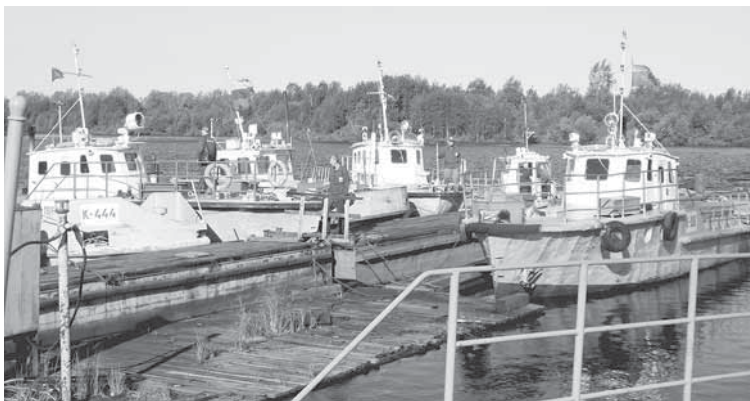
Начало рабочего дня. Теплоходы готовы к работе.

Интересно наблюдать за работой судов. У каждого из них своя задача и своя функция в важной производ-