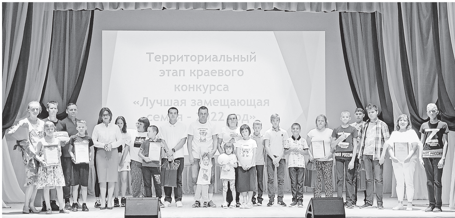
Финал конкурса «Лучшая замещающая семья»