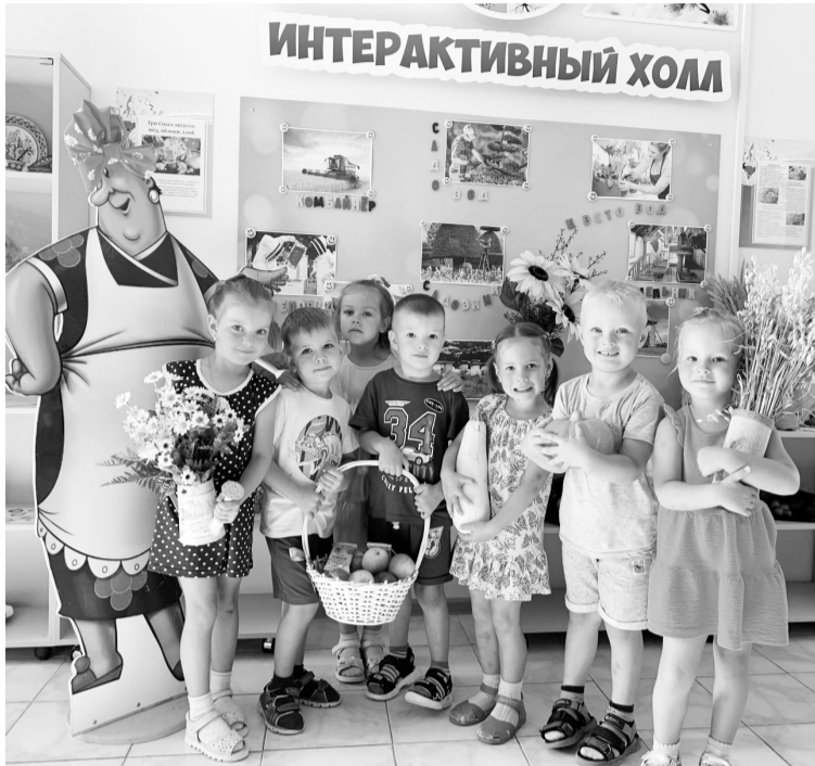
Что нам лето принесло?

У нас все дети талантливые, есть среди них и артисты. В этом мы убедились на августовской премьеры мюзикла «Красная шапочка», в котором приняли участие дети из разных групп — от самых маленьких до самых старших. Громкие овации стали подтверждением их успеха. Уже задумались о гастрольях!