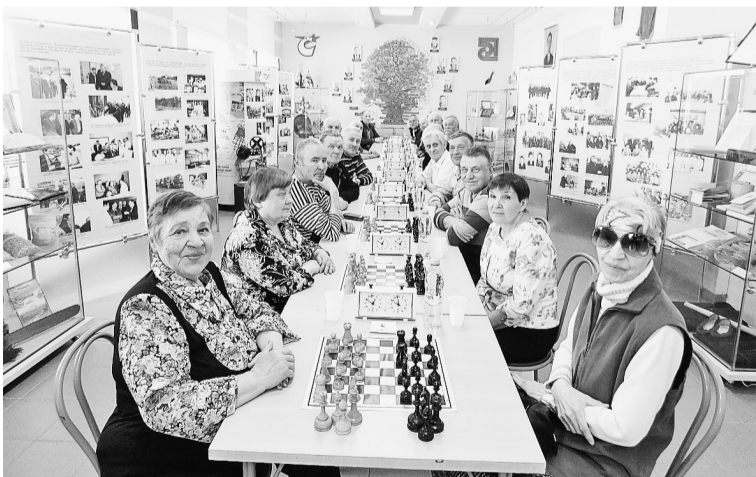
К турниру готовы

А 17 мая эта история о шахматах получила своё продолжение на шахматном турнире. В этой встрече приняли участие 23 ветерана. Судьёй турнира был Р.Э.Гага, ветеран предприятия, а в прошлом капитан команды шахматистов «Бумажник». Соревнования проходили по швейцарской системе. Игра велась за одиннадцатую шахматными досками. Удивили хорошей игрой шахматисты ТЭЦ. Волнения, переживания — все эмоции на лицах игроков.