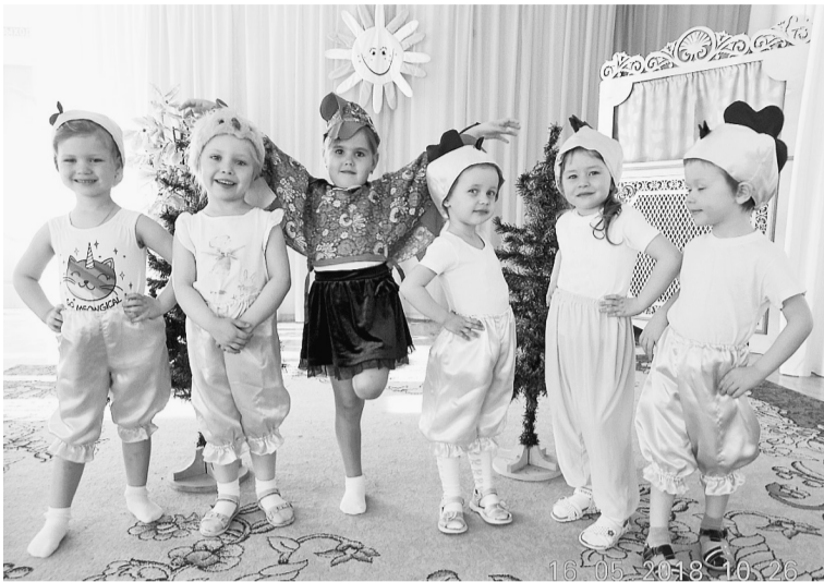
Мы искали солнышко

Ярким событием театральной весны стало представление