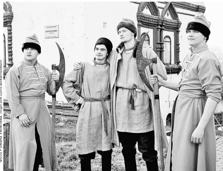
Ночь музеев по-соликамски