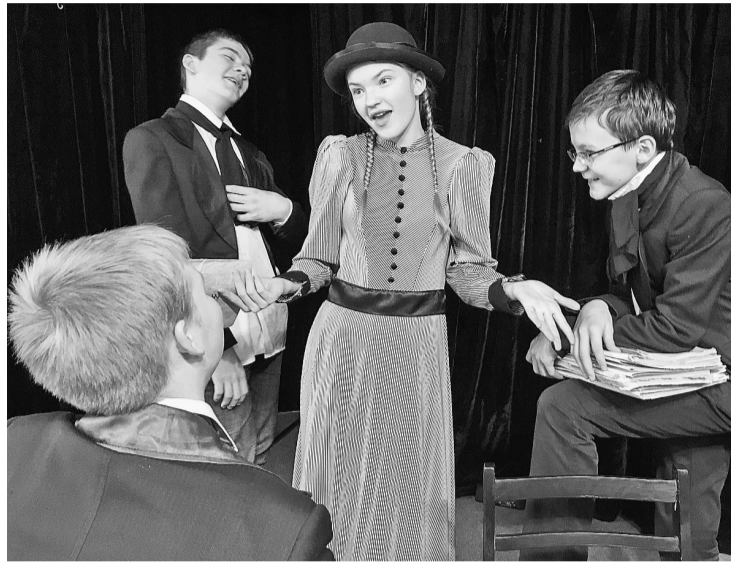
Фрагмент спектакля «Ох, уж этот водевиль!»

С целым звездопадом наград вернулись актёры театра-студии «Перемена» с III-го международного фестиваля «AMiCi» (г. Дезенцано-дель-Гарда, Италия).