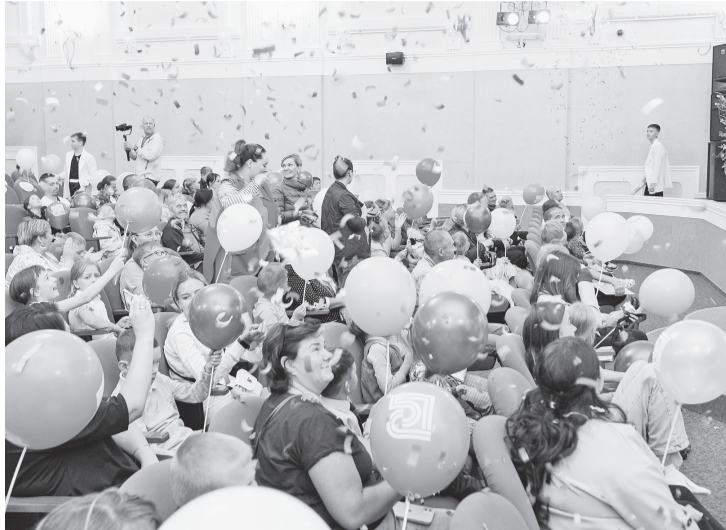
Дождь из конфетти и разноцветные шары — яркий финал праздника

Ещё один сюрприз спрятан в коробке у клоуна. Если уга-