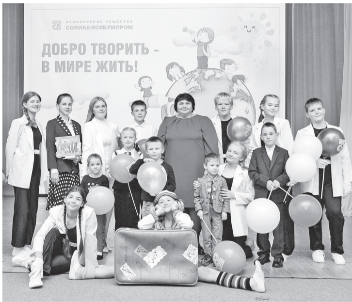
Артисты театра-студии «Перемена» и их благодарные зрители