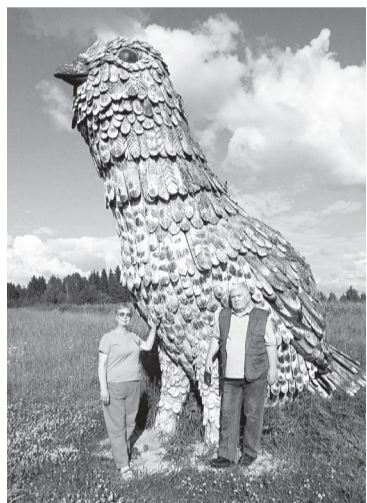
Угадайте! Это Пинь или Ега?

поле, баскетбольная площадка, тренажёры). Есть в посёлке хорошая музыкальная школа. В Доме культуры посёлка много творческих коллективов, в которых занимаются увлечённые танцами, музыкой люди, часто бывают концерты и приезжих артистов, и местных.