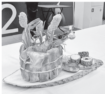
Конкурсное блюдо «По щучьему велению»