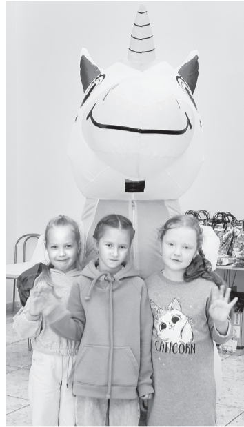
Волшебный Единорог — фаворит у будущих первоклассниц

Да потому, что единорог — символ добра и удачи. А это очень нужные вещи в жизни любого человека, а тем более для первоклассника. Помимо сказочного персонажа можно «пообщаться» и с настоящими животными. Самое пристальное внимание привлёк к себе питон. Каждому хочется его потрогать, погладить, поддержать на руках.