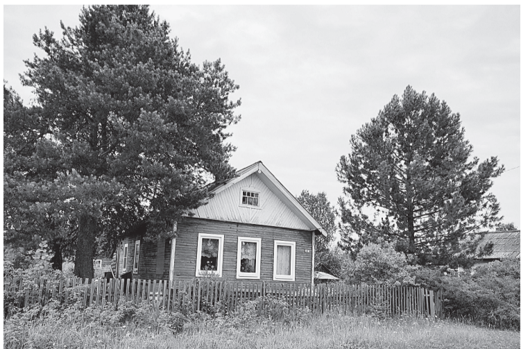
С кедров у родного дома можно собирать шишки с орехами

Но по вечерам в Пинеге такое умиротворение! И ночью, конечно, тишина... Хотя мы были в Пинеге в белые ночи. До двух часов можно книгу читать у окна.