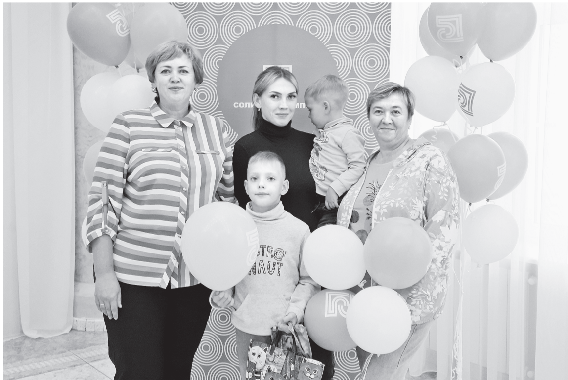
И праздничное фото на память!