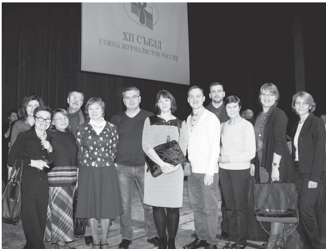
Делегация Пермской краевой организации Союза журналистов России.

ИХ НЕ ХВАТАЛО В ПОСЛЕДНЕЕ ВРЕМЯ РОССИЙСКОЙ ЖУРНАЛИСТИКЕ. ВОПРОСЫ О НАПРАВЛЕНИЯХ РАЗВИТИЯ НАЗРЕЛИ И ТРЕБОВАЛИ ОТВЕТА. ПОЭТОМУ 25 НОЯБРЯ 2017 ГОДА ЖУРНАЛИСТЫ РОССИИ СОБРАЛИСЬ В МОСКВЕ НА ВНЕОЧЕРЕДНОЙ СЪЕЗД.