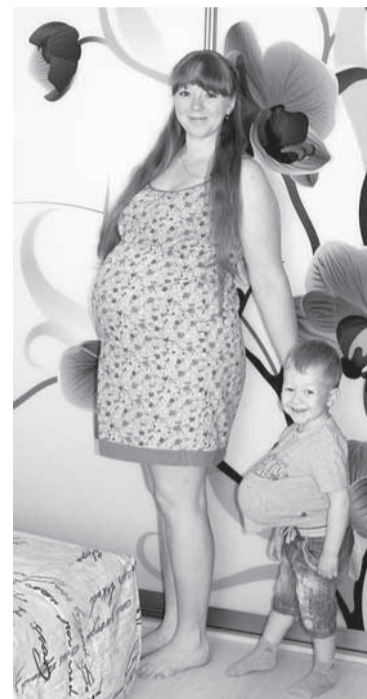
«Жду сестрёнку вместе с мамой» (А.Ю. Матушкина) — лучшая работа в номинации «Я скоро стану мамой».

— Я даже не думала о победе, просто очень хотелось поделиться своими воспоминаниями со свадьбы сына — на фотографии его целуют сестрёнки. И именно этот снимок победил в номинации «А вам слабо?»