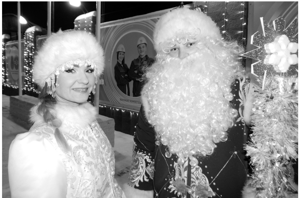
Вы согласны, что наши Дед Мороз и Снегурочка самые красивые?

Каждый год над созданием новогоднего настроения в АО «Соликамскбумпром» трудится целый коллектив «волшебников» — творческих и неравнодушных людей, созданный из работников разных подразделений нашего предприятия.