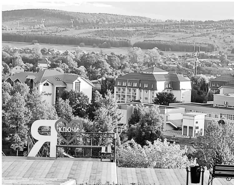
Вид на курорт со смотровой площадки горы Горожище

Уже на следующее утро врач выдала мне план-график посещения лечебных процедур. И я начала лечение, чётко