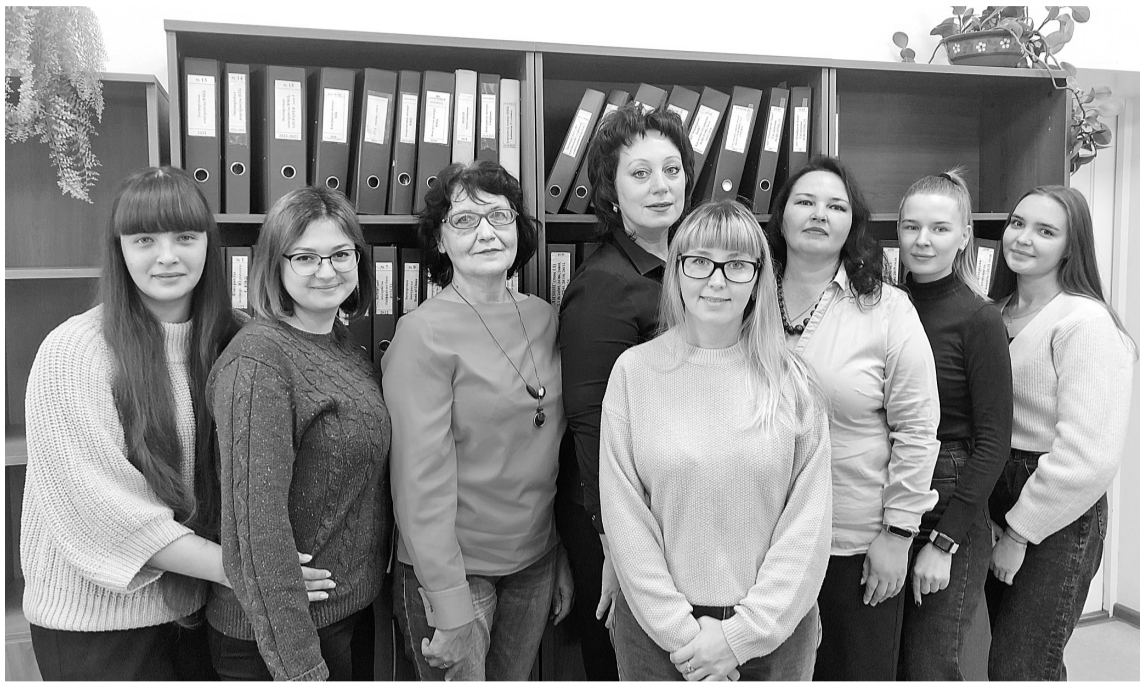
Коллектив финансово-валютного отдела

8 сентября свой профессиональный праздник отмечают финансисты. Финансист понятие обширное и представление о людях этой профессии, не знаю как у вас, но в моём случае, довольно таки расплывчатое.