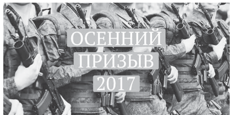
Осенний призыв 2017 года подойдёт к концу 31 декабря.