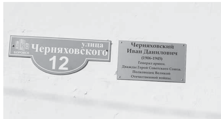
Информационная доска по ул. Черняховского.