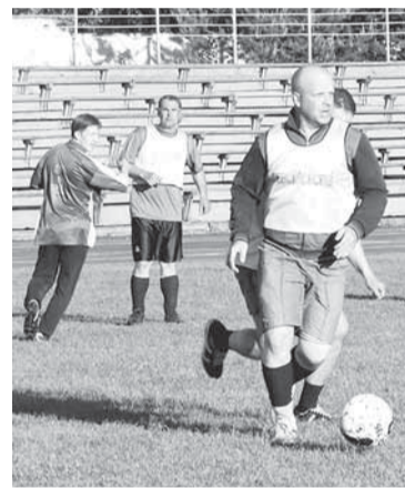
Такой мы любим футбол!

Поблёскивает в лучах солнца заветный кубок — последняя на сегодня не вручённая на-