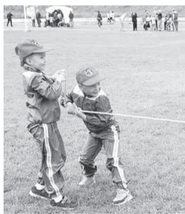
Малые да удалые!

«цветочкам» через «болото» перебираться, — добавляет мама. — Участвовать мы решили из-за сына. Он очень хотел, мечтал о медали! Мы