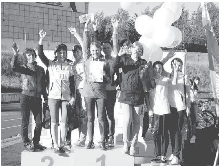
Участницы «Забег на каблуках» удивили не только скоростью.

В «VIP-забеге» участников было меньше, однако интерес от этого только возрос! Вот уж действительно, эти руководи-