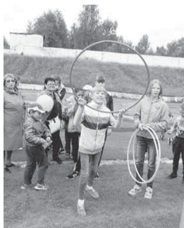
Обруч бросай — жетон получи!

«цветочкам» через «болото» перебираться, — добавляет мама. — Участвовать мы решили из-за сына. Он очень хотел, мечтал о медали! Мы