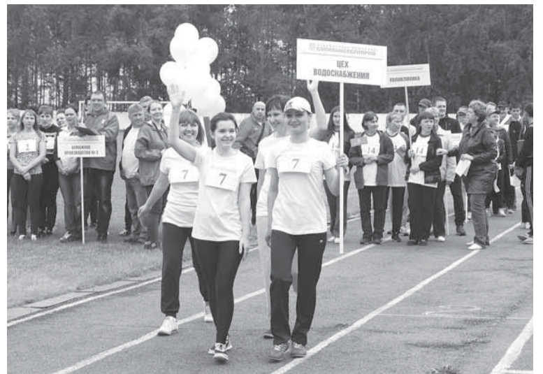
Спортсменки цеха водоснабжения.