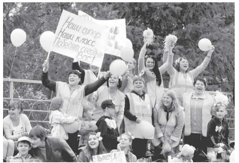
Самые яркие болельщики — в АТЦ!

тельницы команд БП № 2, управления и ЦМТОП.