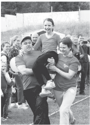
Главная ценность — ребёнок!

— Папы, помните, прежде всего — ребёнок, а не скорость! — наставляет ведущая