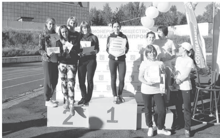
Победители и призёры в легкоатлетической эстафете среди женских команд.

на «Спортивный БУМ», — завершает беседу папа. — Обычно в качестве зрителя. Однако и участвовать очень интересно!