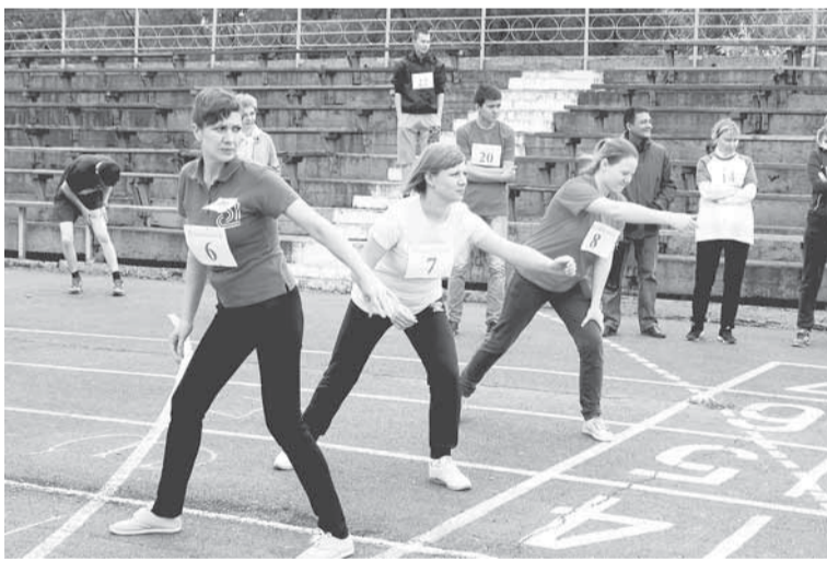
В эстафете главное — общий результат.

И большие, с символикой предприятия, изящно изгибающиеся на ветру, и маленькие, оформленные в цвета команд, танцующие в руках зрителей. На трибунах — радостное оживление. Вот болельщики ООО «Соликамская ТЭЦ» надувают воздушные шары. Группа поддержки ЦОГП разворачивает плакаты с речёвками. С первых минут присутствия