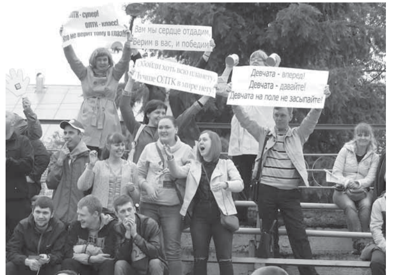
Группа поддержки ОЛТК старалась не зря.

Стартует первый забег «мужской» эстафеты. За золото сегодня будут бороться