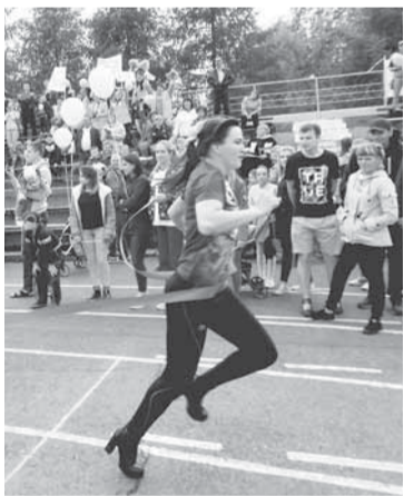
Финиш на каблуках? Легко!

Традиционно огромный интерес вызывает «Забег на каблуках». Наверное, каждой из нас хоть раз в жизни приходилось пробежаться в любимых туфельках — за уходящим автобусом, за расшалившимся ребёнком. Да мало ли бывает ситуаций! Но сделать это на время, под крики болельщиков, бок о бок с 12 соперницами? Легко!