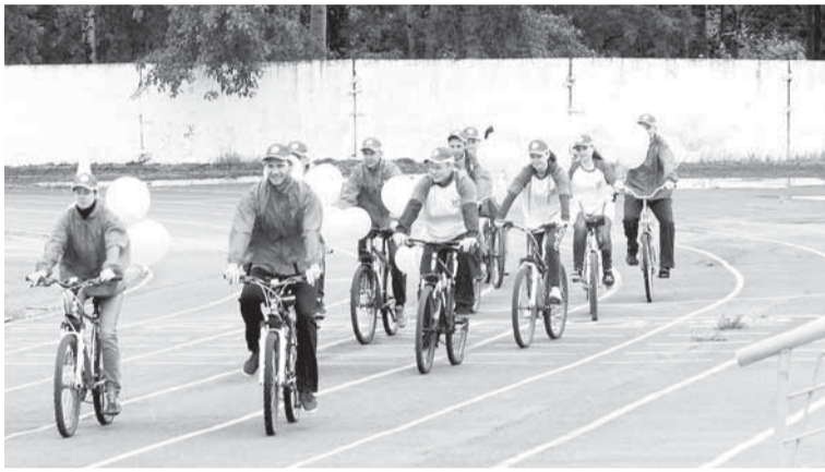
Открывают парад велосипедисты молодёжного объединения «Бумеранг».

Где самые яркие и шумные болельщики? Где самые быстрые и волевые спортсмены? Где самые дружные и сплочённые команды? Конечно же, на нашем «Спортивном БУМе», который состоялся 30 июня уже в одиннадцатый раз!