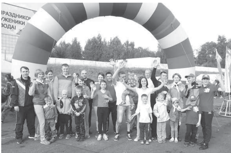
Участники и победители конкурса «Спортивная семья».

— Мне очень понравилось, как в одном из заданий папе и маме надо было нести меня на руках, — делится 6-летний