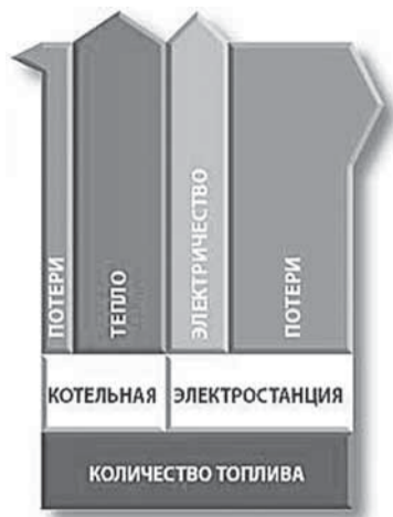
Раздельная выработка энергии (котельные и электростанции).

Проще говоря, в погоне за снижением инвестиций увлеклись строительством котельных (дешевле, чем стро-