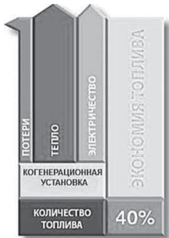
Экономия топлива при когенеративном типе выработки энергии (ТЭЦ).