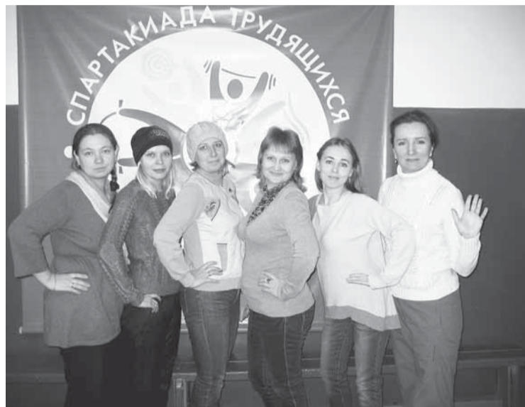
Женские команды детских садов одержали победу. Фото на память у баннера — символа Спартакиады трудящихся ОАО «Соликамскбумпром».

Спартакиада трудящихся ОАО «Соликамскбумпром» открыта! В тире на стадионе «Бумажник» 28 ноября состоялись первые командные соревнования по дартсу.