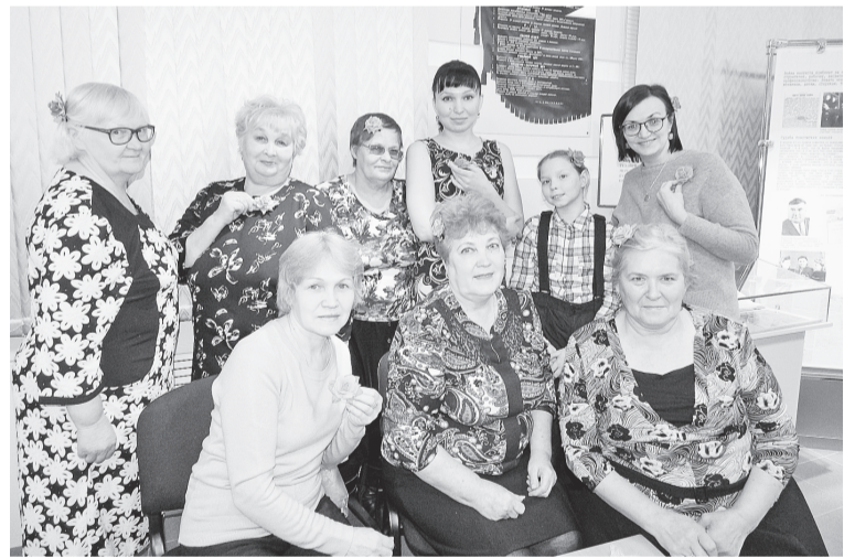
Участницы мастер-класса со своими волшебными изделиями

Если вы думаете, что фоамиран — это какой-то невиданный в наших краях зверь, то вы ошибаетесь. Встречается он в магазинах рукоделия, и представляет собой декоративный пенный материал, приятный на ощупь и чем-то напоминающий замшу.