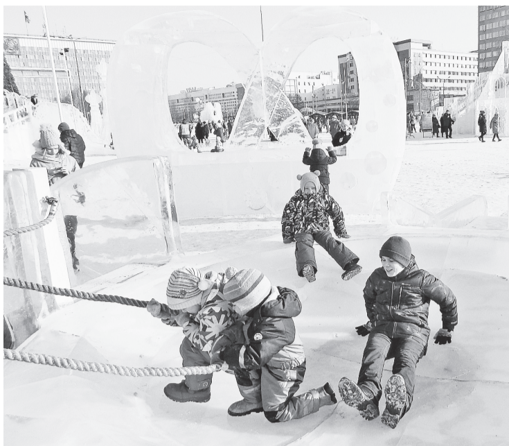
Ледяные чаши-ловушки притягивают больших и маленьких детей как магнит

Как рассказали участники группы, осматривавшей экспозицию «Романовы», им также очень помогла освоиться в новом музее экскурсовод. Дети особенно заинтересовались представленной на