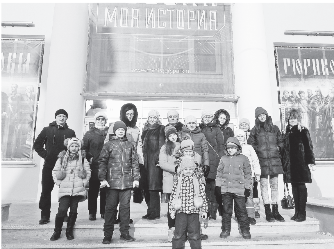
Бумажники открыли для себя интереснейший музей — мультимедийный исторический парк «Россия — Моя история. Пермский край»

Во-вторых, в этом необычном музее использованы приёмы видеоинфографики, анимации, трёхмерного моделирования и цифровых реконструкций. На экранах и сенсорных панелях размещена информация о главных исторических событиях прошлого. Можно просто почитать и посмотреть картинки, а можно пройти тест,