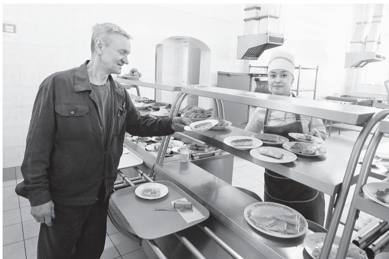
На этой неделе каждый полакомился в столовых предприятия любимыми блинами

Любимая многими масленичная неделя выдалась для работников цеха общественного питания по-настоящему жаркой, а точнее — горячей, чадной, пропитанной вкусными запахами раскалённого масла и блинов. И неудивительно, ведь традиционного русского угощения ждал весь бумкомбинат.