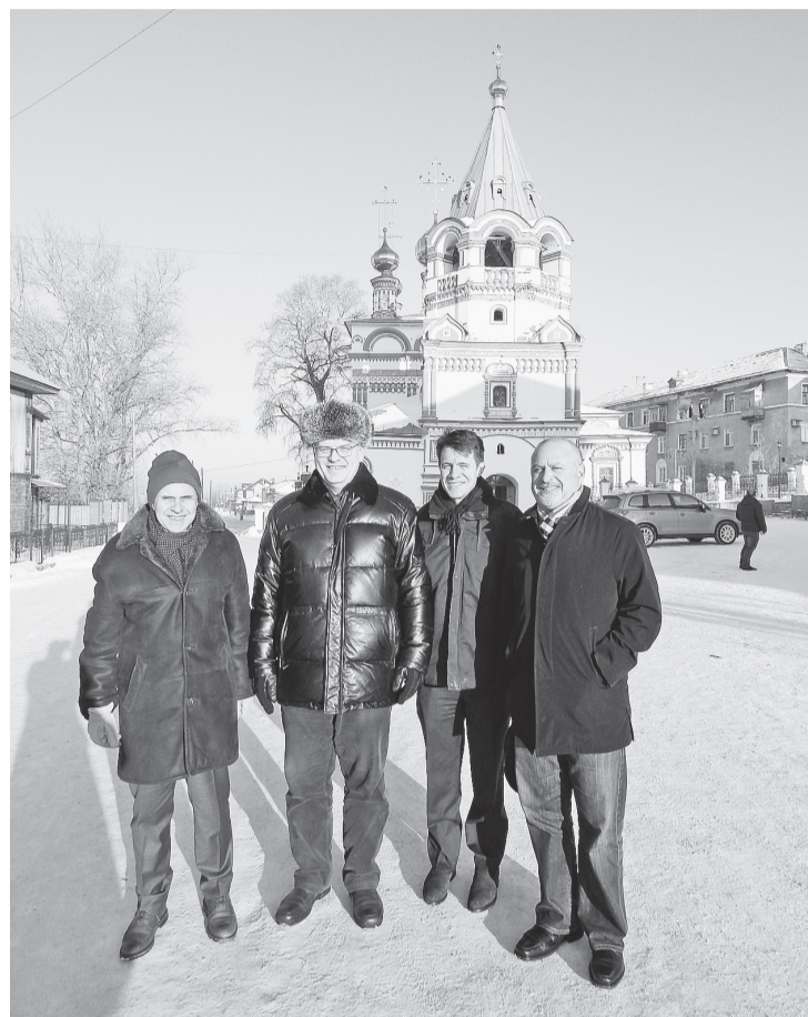
Представители фирмы «Centhal National-Gottesman» с удовольствием сделали фото на память о старинном Соликамске и русском морозце

На этой неделе к нам приезжали представители фирмы «Centhal National-Gottesman» (CNG). Они познакомились ближе не только с предприятием, но и с городом.