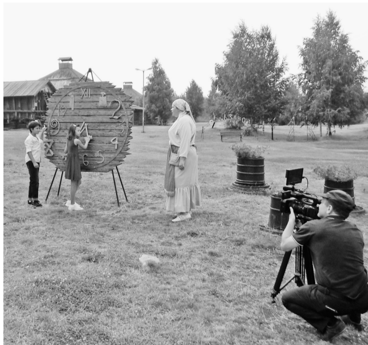
Съёмка видео-уроков в дополнение к новому учебнику в Музее соли

Отдел готовит разъяснительные материалы об угрозе инфекции, о профилактике. В отделе разработаны и изготовлены плакаты для всех структурных подразделений и дочерних предприятий. Создан стенд, на котором сотрудники ОСО ежедневно обновля-