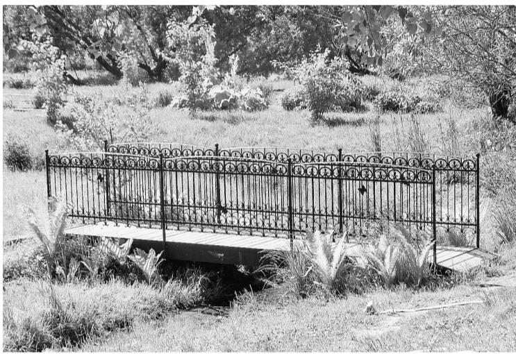
Благодаря помощи бумкомбината в ботаническом саду появился изысканный мостик

вводим новую традицию. Хочу отметить, что реализация нашего проекта стала возможной именно благодаря помощи АО «Соликамскбумпром».