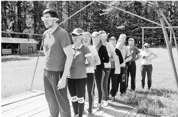
Команда проходит этап «Манипулятор»