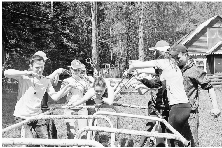
Каждый мог почувствовать себя суперменом! Или супергерл?