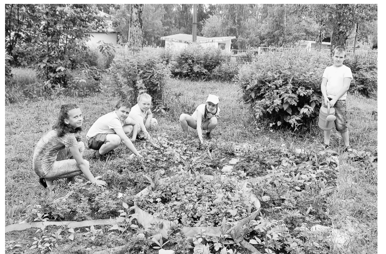
За созданным в рамках проекта цветником бережно ухаживают сами дети