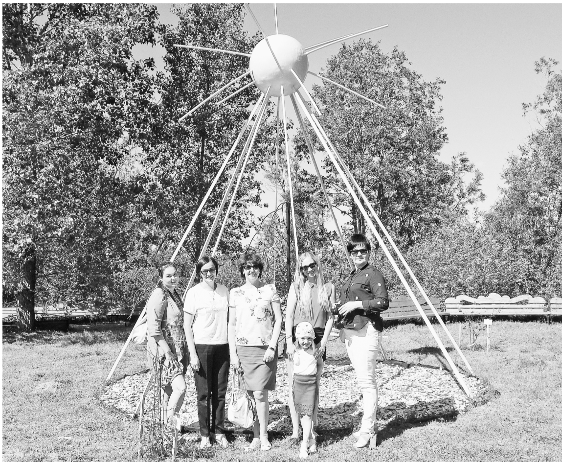
Необычный арт-объект беседка «Солнце» в любую погоду порадует яркими летними лучами