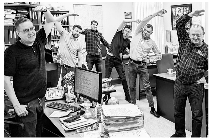
Гимнастика в ОЛХ — ежедневно

С 22 по 28 апреля 2024 года Министерство здравоохранения Российской Федерации объявило недельную популяризацию лучших практик укрепления здоровья на рабочих местах.