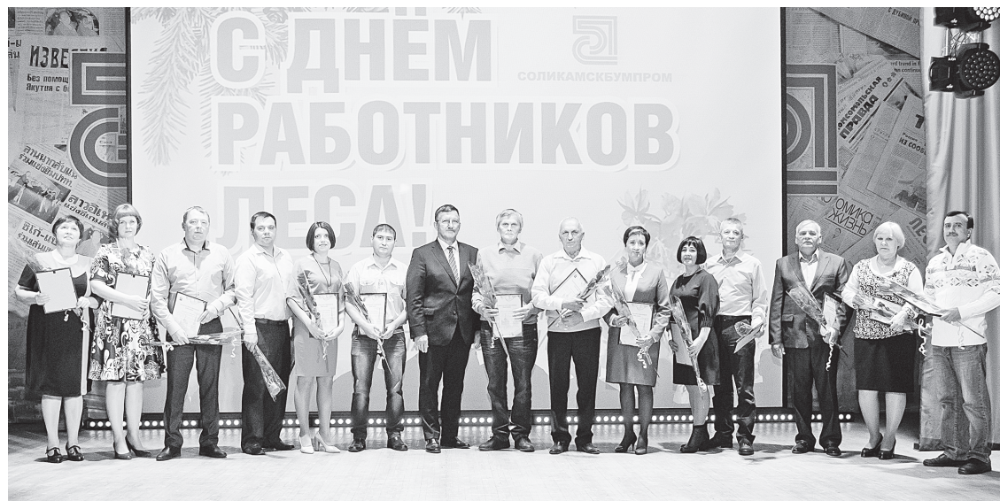
Награждённые Благодарственным письмом главы г. Соликамска.

Благодарственные письма Губернатора Пермского края и Почётной грамотой Министерства промышленности, предпринимательства и торговли Пермского края вручил удостоенным этих наград бумажникам высокий гость — Министр промышленности, предпринимательства и торговли Пермского края Алексей Валерьевич Чибисов . Он от души поздравил коллектив АО «Соликамскбумпром» с профессиональным праздником: