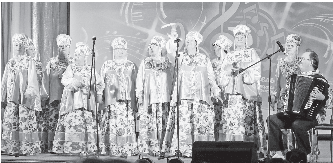
Хор ветеранов АО «Соликамскбумпром» «Лейся, песня!»