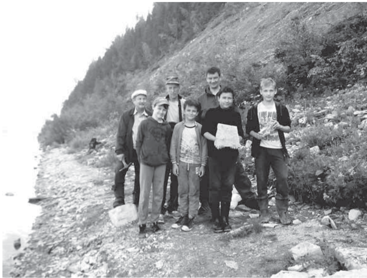
Участники экспедиции на обнажении с образцами пород.

мощность отложений достигает 79 метров и представляет собой переслаивание глинистых известняков с серыми алевритами и песчаниками. Тюлькинское отложение является эталоном для этого геохронологического отрезка времени. В отложениях горизонта встречаются отпечатки гигантских стрекозоподобных насекомых. Памятник был открыт в 1932 году геологом Г.Н. Фредериксом и о нём написано в энциклопедическом издании «Геологические памятники природы России». В 1983 году памятник описали Л.В. Баньковский и П.А. Софроницкий .