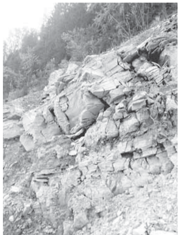
Тюлькинское геологическое обнажение.

Немного не доходя до поворота реки, мы видим белые скальные выходы. Это Тюлькинское обнажение — стратиграфический геологический памятник природы федерального значения. Здесь расположен разрез соликамского горизонта Уфимского яруса верхнего отдела Пермской системы. Это порядка 275 миллионов лет назад. Суммарная