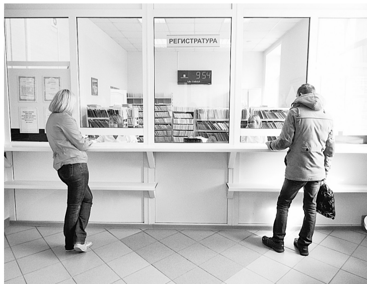
Поликлиника АО «Соликамскбумпром» — одна из лучших в городе!