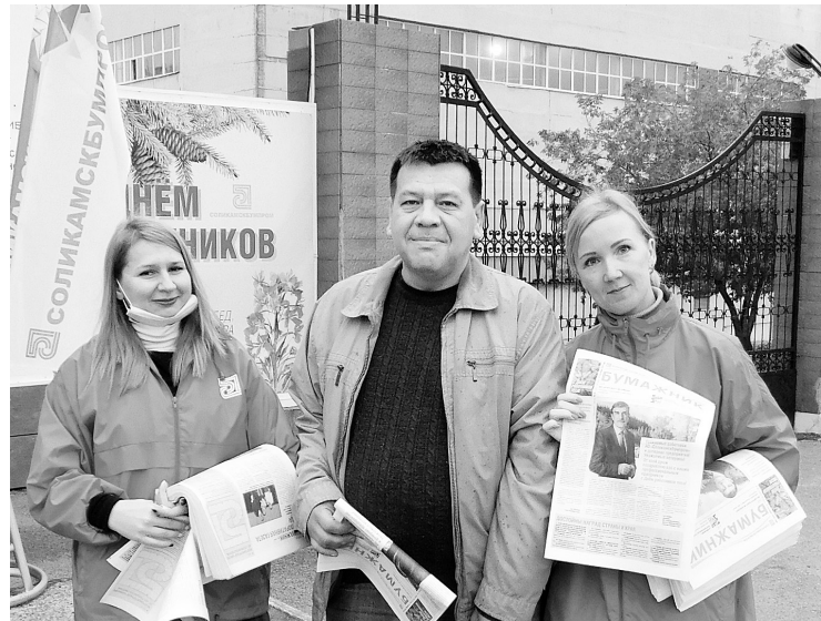
Традиция вручения праздничного номера «Бумажника»

Как бумажники отметили в 2020 году День работников леса можно увидеть на фотографиях, размещённых на сайте АО «Соликамскбумпром» http://www.solkam.ru в фотоголосе.