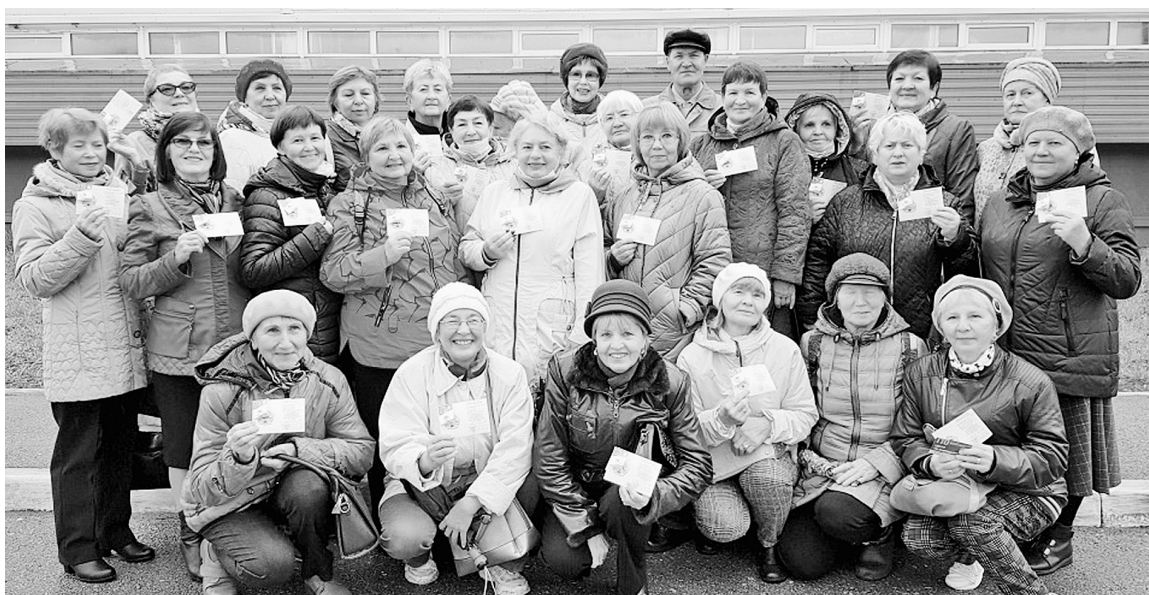
Ветераны готовы к труду и обороне

В субботу любители спорта Соликамска собрались на традиционное мероприятие — Кросс Нации. На спортивном празднике также состоялось вручение знаков ГТО.