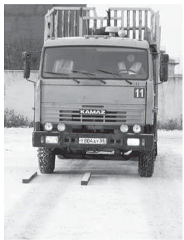
«Главное — чувствовать габариты машины».

Такое ощущение, что все участники этой номинации уже прошли предварительный