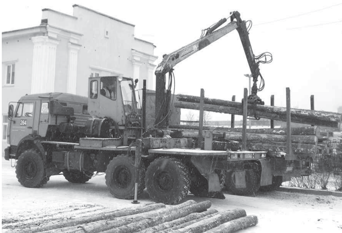
Секрет победы: водитель и огромная машина работают как единое целое.

ВОДИТЕЛЯМ АТЦ, АЛЦ И ЦЕХА ПО ПЕРЕВОЗКЕ ДРЕВЕСИНЫ ОСП «ВИШЕРА» НЕ СТРАШНЫ НИ ОБЛЕДЕНЕВШИЕ ТРАССЫ ВДАЛИ ОТ ДОМА, НИ ЛЕТНЕЕ БЕЗДОРОЖЬЕ, ЗАТЕРЯННОЕ В ЛЕСАХ. НО 28 ОКТЯБРЯ ДАЖЕ ОПЫТНЫЕ АСЫ НЕ СКРЫВАЮТ — ВОЛНУЮТСЯ. А ВСЁ ПОТОМУ, ЧТО ВПЕРЕДИ ТРАДИЦИОННЫЙ КОНКУРС НА ЗВАНИЕ ЛУЧШЕГО.