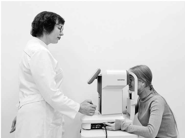
Пневмотонометр помогает врачу измерить внутриглазное давление пациенту бесконтактным методом

В «тёмной комнате» установлен прибор «Периком» для компьютерной периметрии глаз. Это современный и более точный метод выявления границ перифе-