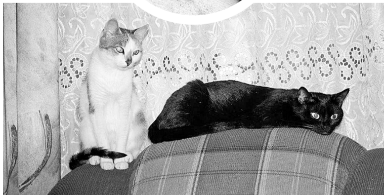
Мурзя и Глаша

хозяйева не скучали. Они быстро устраиваются в машине и — на дачу, позвали домой — едут домой. Любят играть, бегают, сшибая всё на своём пути. Но за ласку и тепло им всё легко прощается.