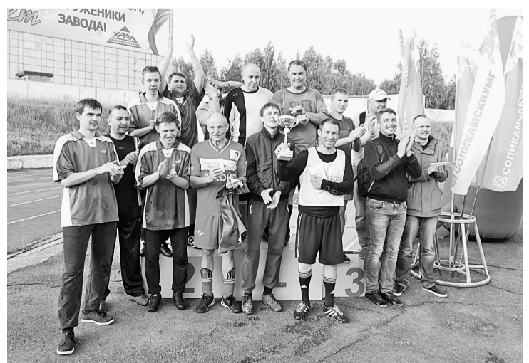
Победители и призёры блиц-турнира по футболу (2017 г.)

работы, должности, контактного телефона, названия номинации и фотоработы в электронном виде направляются с пометкой ФОТОКОНКУРС по адресу электронной почты: najle.muzafarova@solbum.ru , или на электронном носителе в отдел по связям с общественностью каб. 111 (тел. для справок: 6-46-77).