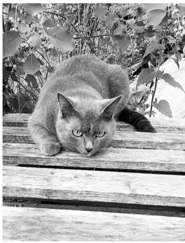
Чика в засаде