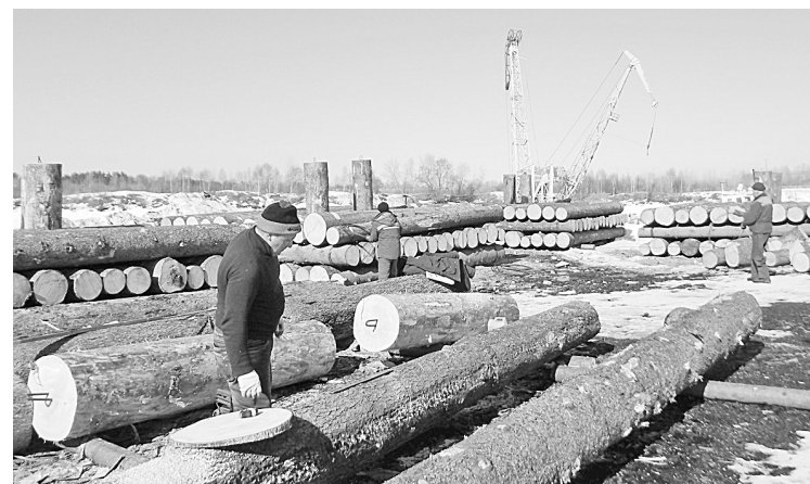
Изготовление прикольных плиток

— Мы постоянно отслеживаем приход древесины по воде, подготовленной к сплаву, получая актуальную информацию от отдела лесоснабжения. На выполнение плана влияют погодные условия, состояние дорог.