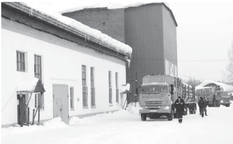
На территории ОСП «Вишера».

— Остановимся, и всё будет деградировать — про-