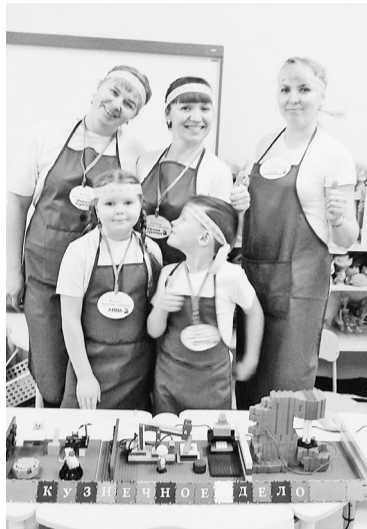
Дружная команда из «Теремка»

Темой проекта выбрали — «Кузнец — всем ремёслам отец». Была проведена большая предварительная работа с детьми всей группы, мы изучили истоки возникновения кузнечного мастерства на