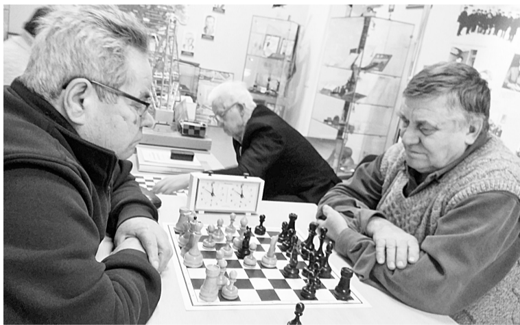
Турнир прошёл в дружеской обстановке