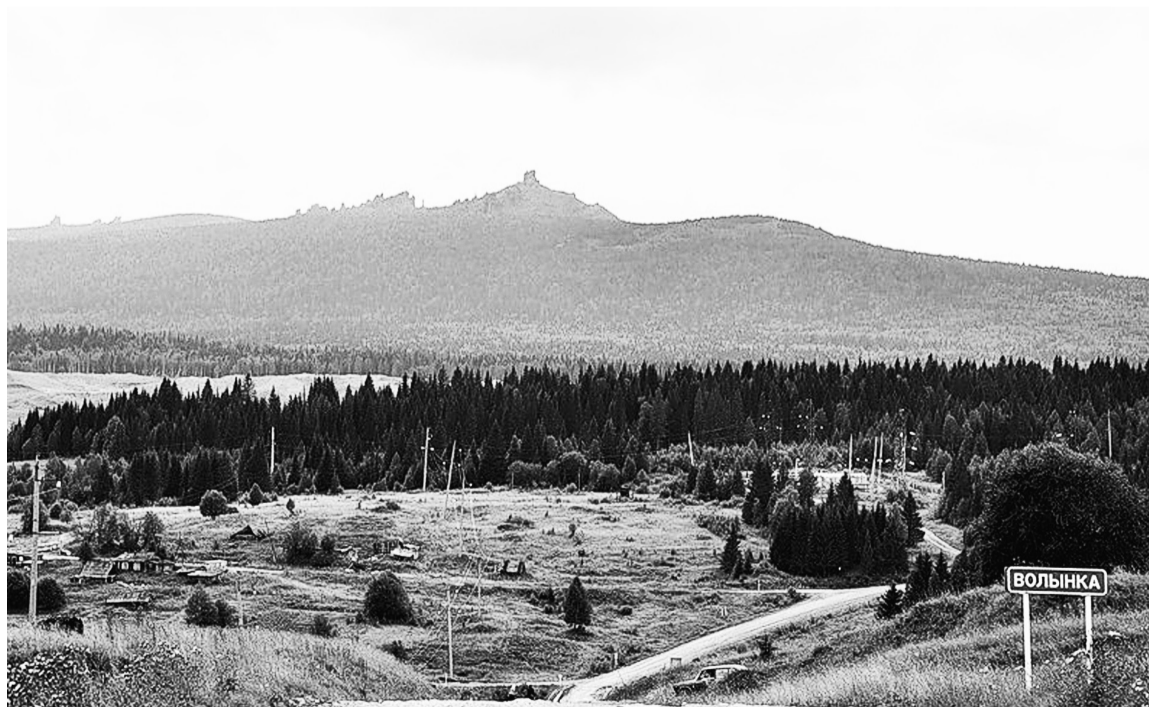
Леса Красновишерского района