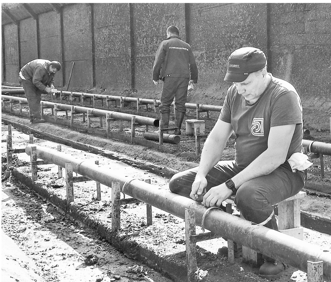
ЦЦР приступил к работе в очищенном от ила аэротенке

На территории цеха очистные сооружения АО «Соликамскбумпром» заметно прибавилось людей и техники, идут ремонтные работы. О ремонте прошу рас-