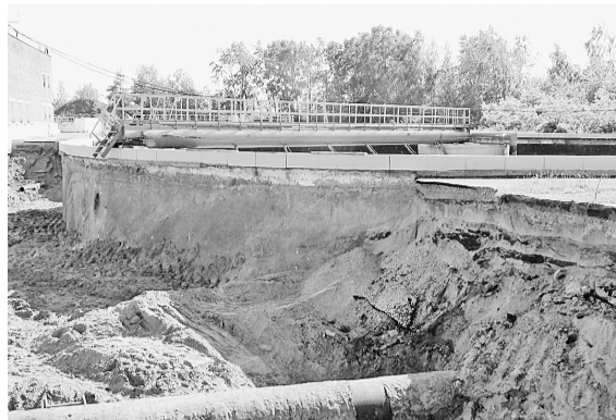
Ремонтные работы на радиальных отстойниках