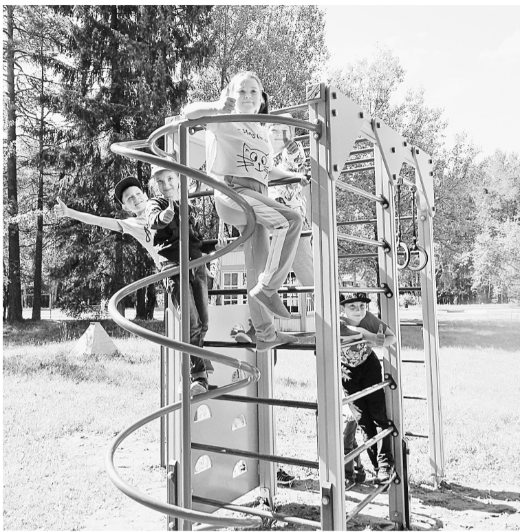
Новые спортивные комплексы пришлись ребятишкам по душе

Вот уже 47 лет оздоровительный лагерь «Лесная сказка» служит излюбленным местом летнего отдыха соликамских мальчишек и девчонок. Без новых друзей, интереснейших мероприятий и вкусных булочек по-прежнему не обходится ни одна смена. А чтобы лагерь и дальше оставался в строю и радовал своих гостей, АО «Соликамскбумпром» регулярно оказывает ему спонсорскую помощь.