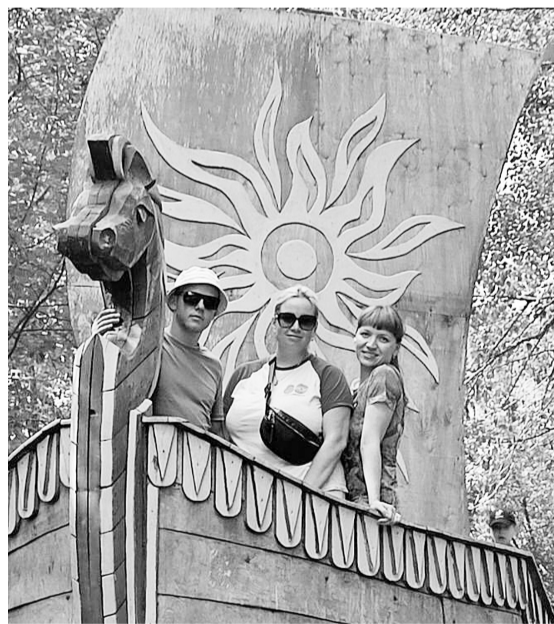
В деревне Ермака