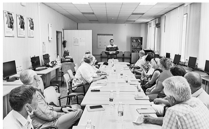
Профактив за «круглым столом»

В сентябре ЖКХ передано в муниципальную собственность.