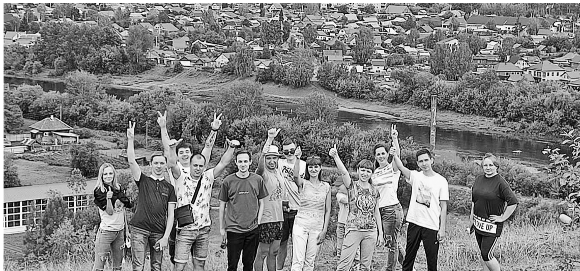
Город видно как на ладони

В прошлые выходные, 3 июля активная молодёжь АО «Соликамскбумпром» посетила достопримечательности города Кунгура. Своими мыслями и впечатлениями о поездке поделились некоторые участники поездки.