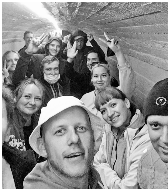
В Кунгурской ледяной пещере