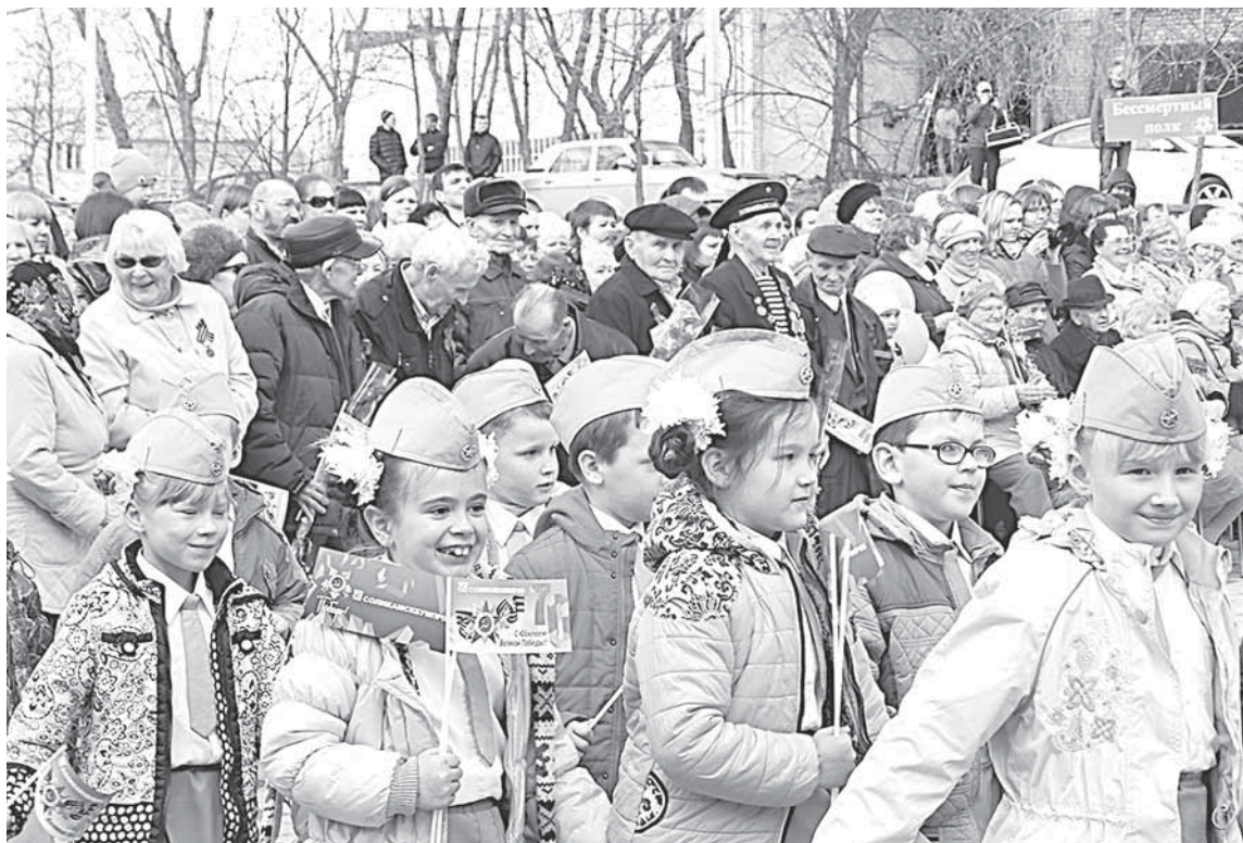
Воспитанники детских садов НДОУ «ЦРР «Соликамскбумпром» маршируют перед главными гостями праздника.

ЮБИЛЕЙ ПОБЕДЫ — ЭТО САМЫЙ ВАЖНЫЙ ПРАЗДНИК НЕ ТОЛЬКО ДЛЯ НАШЕЙ СТРАНЫ, НО И ДЛЯ КАЖДОЙ СЕМЬИ. НА ТОРЖЕСТВЕННЫЙ МИТИНГ У ПАМЯТНИКА ПАВШИМ ВОИНАМ-БУМАЖНИКАМ 8 МАЯ 2015 ГОДА ПРИШЛИ ВЕТЕРАНЫ, БУМАЖНИКИ С ДЕТЬМИ И БЛИЗКИМИ.