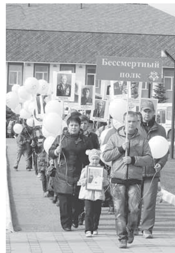
Колонна Бессмертного полка выступает на праздничную площадь у памятника павшим воинам-бумажникам.

Черный цвет ленты означает дым, а оранжевый — пламя. Георгиевские ленты занимают наиболее почетное место в ряду многочисленных коллективных наград (отличий) частей Российской армии.