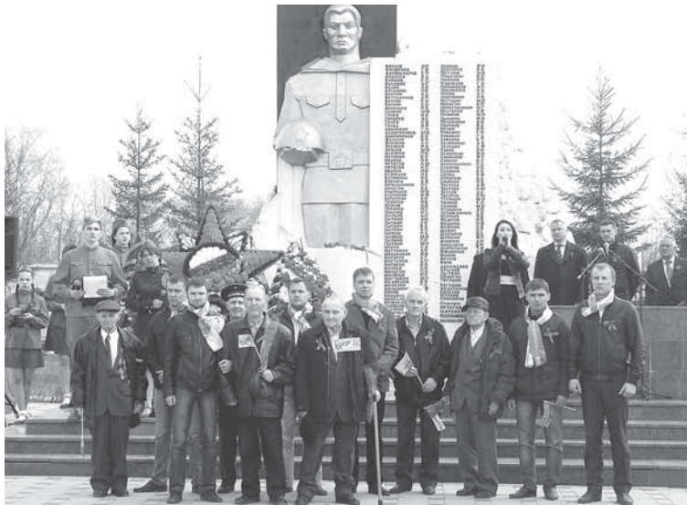
Возложение венков и минута молчания. На фото ветераны и молодые работники предприятия.

Торжественные речи вызвали солидарность и чувство гордости за поколение победителей, строки стихотворений о войне задевали за живое. Сама атмосфера — улыбающиеся ветераны