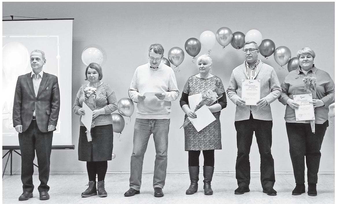
Вручение Почётных грамот ООО «Соликамская ТЭЦ»

К свету и теплу тянется всё живое на земле. Поэтому мы так любим лето. А вот зимой у нас большую часть суток темно, за окном — то холод, то мороз. Самое время оценить, насколько важен труд энергетиков. 22 декабря отмечают свой профессиональный праздник люди, чьим делом жизни стало производство энергии, без которой не было бы света и тепла.