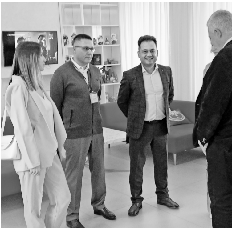
В минуты перерыва