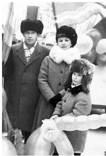
Работники стройтреста вышли на демонстрацию 7 ноября