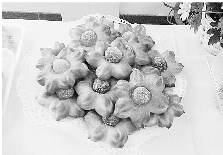
Ватрушки-цветочки с мармеладом

Продолжительность номера должна составлять не более 3-х минут. Каждый участник и коллектив может участвовать не более чем в двух номинациях.