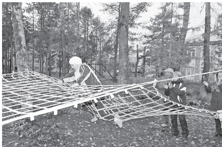
Одно из испытаний турслёта — «паутина»

К этому событию в Центре туризма и молодёжи «Соликамский горизонт» 12 октября организовали туристский слёт «Не расстанусь с комсомолом». Участники слёта доказали, что комсомол — это вечная молодость. Кроме типичных для турслёта заданий, как «паутина», например, мы стреляли по кеглям из настоящей рогатки, прыгали в «резиночку» и играли в «камушки». А потом нас ждала экскурсия в минералогическом музее «Камни здоровья» и чаепитие.