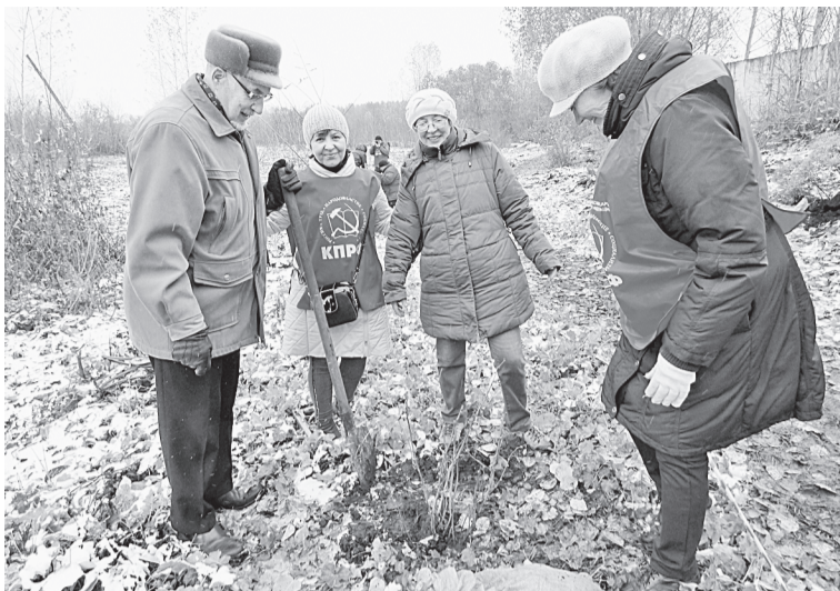
Акция «100 деревьев к 100-летию комсомола»