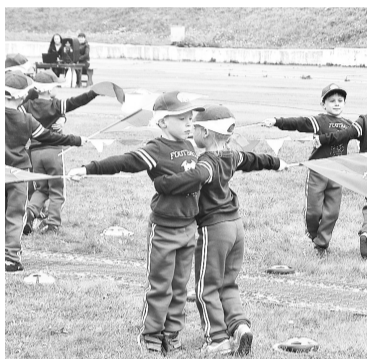
Яркое выступление спортсменов из д/с № 25

мальчиков. — Я старался ехать быстро, боялся, что меня обгонят!