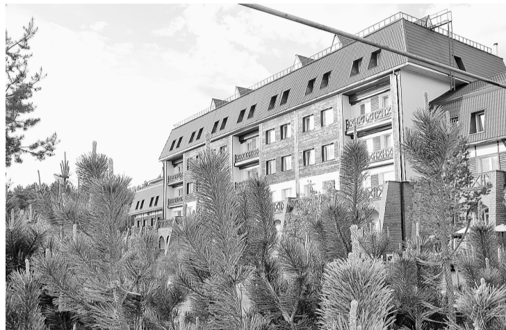
Санаторий напоминает уютный европейский городок

Замечательно отдыхается в любую погоду в чудесном лесном уголке — в санатории «Демидково». Уютно, красиво, спокойно. И совсем недалеко.