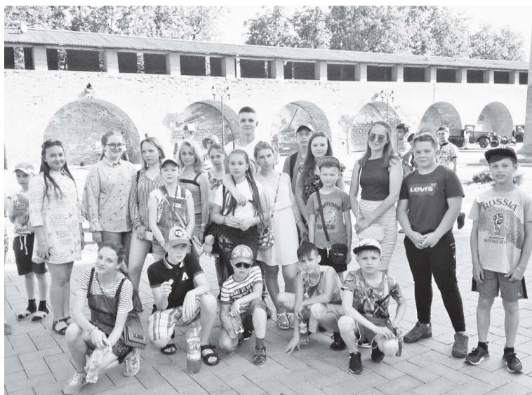
Соликамские мальчишки и девчонки в Нижегородском кремле

Так было и на этот раз. Мальчишки и девчонки в возрасте от 7 до 15 лет не просто участвовали во всех игровых и спортивных программах на борту теплохода. Специально для них были организованы стоянки, во время которых юные путешественники могли вволю искупаться, чему очень способствовала погода. В Нижнем Новгороде и Казани для ребят провели увлекатель-