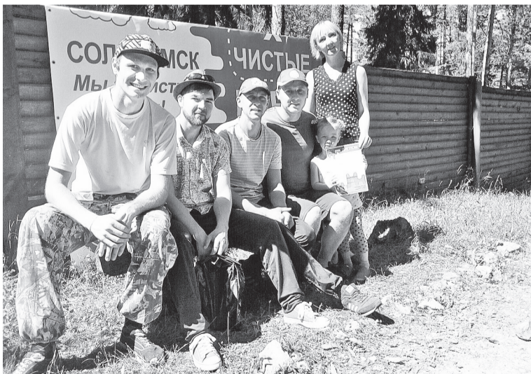
Победители «Чистых игр»

— Мы победили потому, что сделали всё быстро и каче-