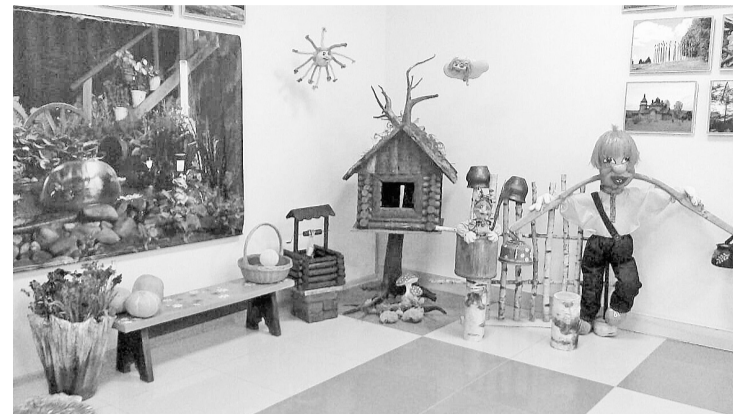
Колоритный уголок сада-огорода

Мне всегда интересно посмотреть творческие работы народных умельцев. Я всегда посещаю наш музей «Соликамскбумпром», когда там проходят подобные выставки.