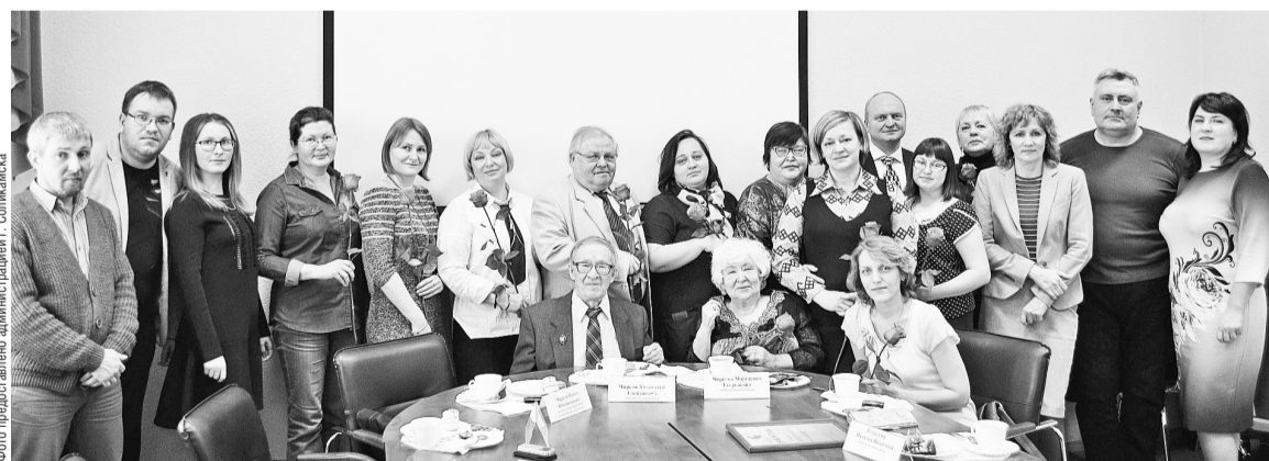
Традиционная встреча представителей СМИ с администрацией г. Соликамска, приуроченная ко Дню печати

Который год подряд администрация Соликамска приглашает представителей городских СМИ на встречу с главой города и поздравляет с Днём печати.