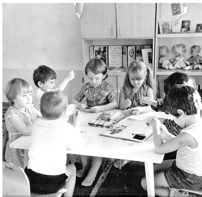
Творческая мастерская