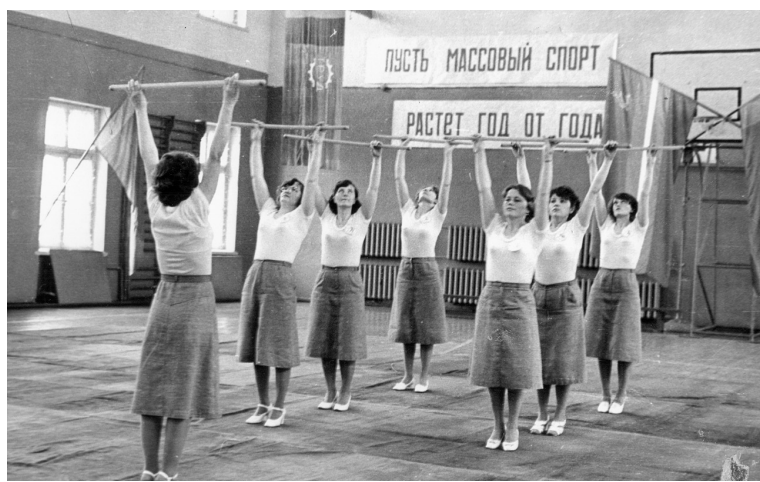
Производственная гимнастика