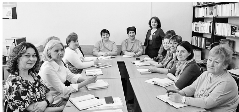
Библиотеки подводят промежуточные итоги акции

По информации предоставленной МБУК «ЦБС» города Соликамска