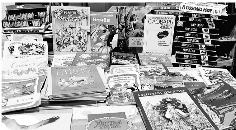
В библиотеке № 6

В Международный день дарения книги — 14 февраля — был дан старт акции «Люблю читать — дарю книгу!», организованной по инициативе депутата Законодательного Собрания Пермского края Виктора Ивановича Баранова.