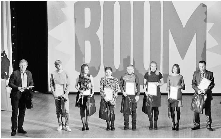
Награждённые Благодарственным письмом АО «Соликамскбумпром» по итогам производственной деятельности

— Наш всеми любимый ежегодный праздник вновь объединил молодых сотрудников предприятия, чтобы мы почувствовали себя одной большой семьёй, поскольку в нашем коллективе важна не только трудовая, но и неформальная связь между работниками предприятия, — отметила в своей приветственной речи председатель профсоюзного ко-