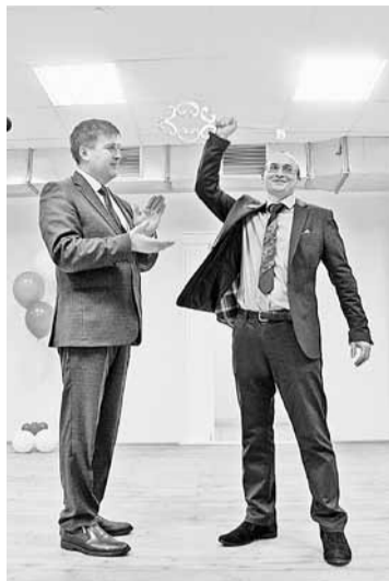
Торжественная передача ключа от новой школы

Уважаемые педагоги, надеюсь, вы сможете вдохнуть в эти новые стены атмосферу творчества и взаимопонимания, познания и развития.