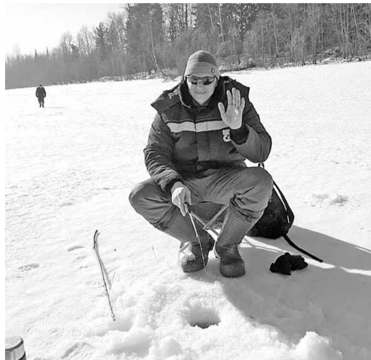
Среди работников ДМП немало заядлых рыбаков

Важным компонентом здорового образа жизни является психоэмоциональная сторона. Рыбалка подойдёт и тем, чья работа сопряжена с нервно-эмоциональными перегрузками.