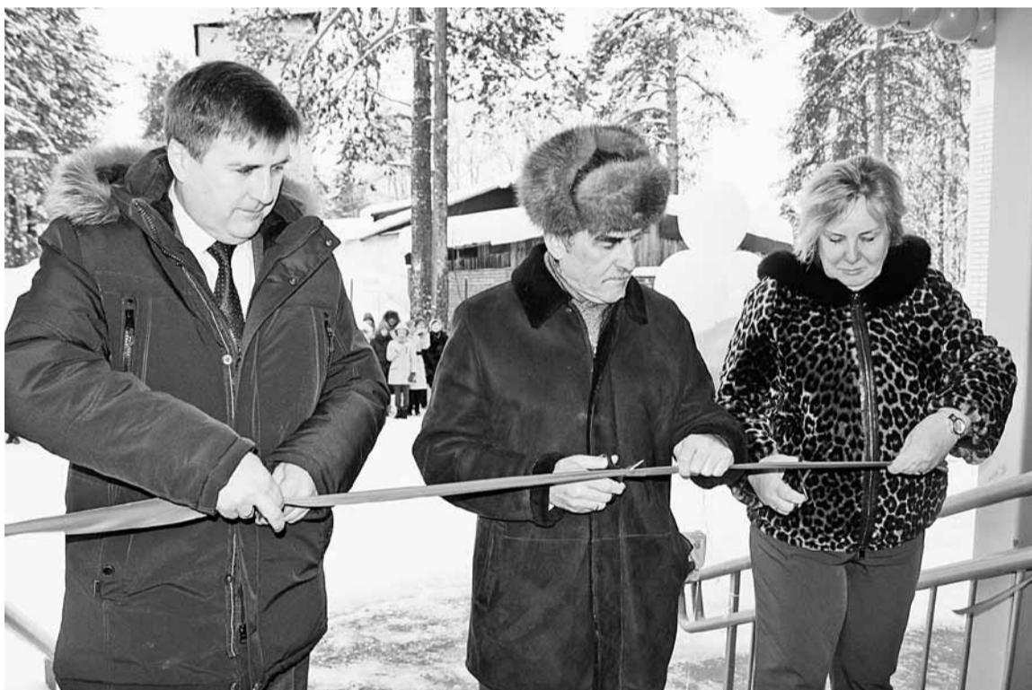
Открытие школы в Красновишерске

15 января состоялось торжественное открытие нового здания школы №1. Теперь ученики и учителя продолжают открывать удивительный мир знаний в стенах современной, просторной, светлой и тёплой школы.