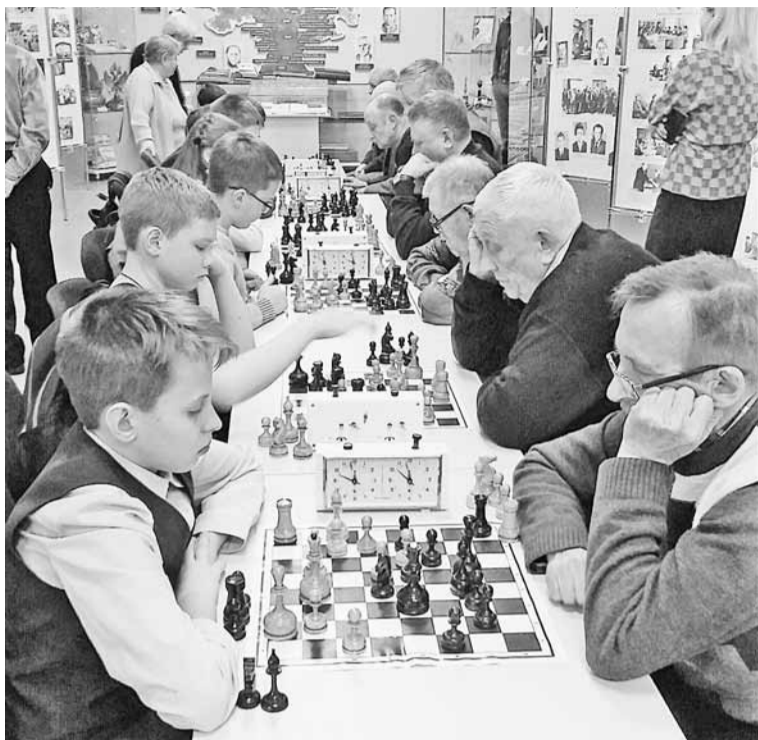
Напор юных против опыта ветеранов