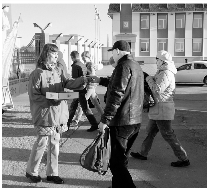
Бумеранговцы вручают Георгиевские ленты