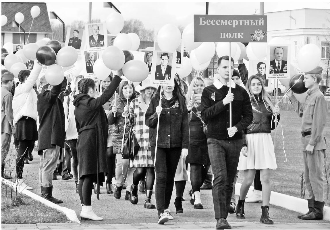
Вновь в митинге участвует «Бессмертный полк»

Продолжились мероприятия с раннего утра 6 мая. На площади у главной проходной бумкомбината под музыку