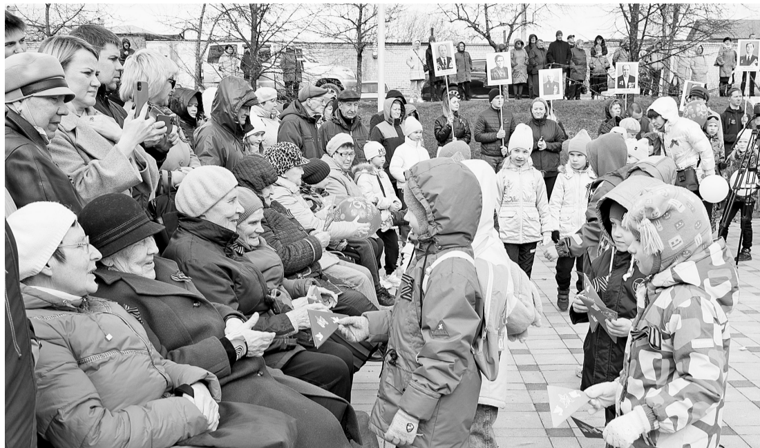
Воспитанники детских садов поздравляют ветеранов