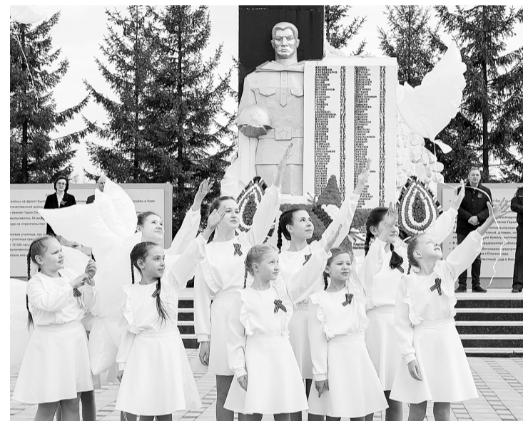
Вокальная студия «Мелодия» исполняет песню «Отмените войну»